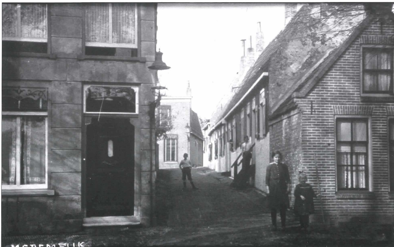
Afb. 1: Breedstraat en Heerensteeg, links de toenmalige woning van Brouwer, ca. 1915.