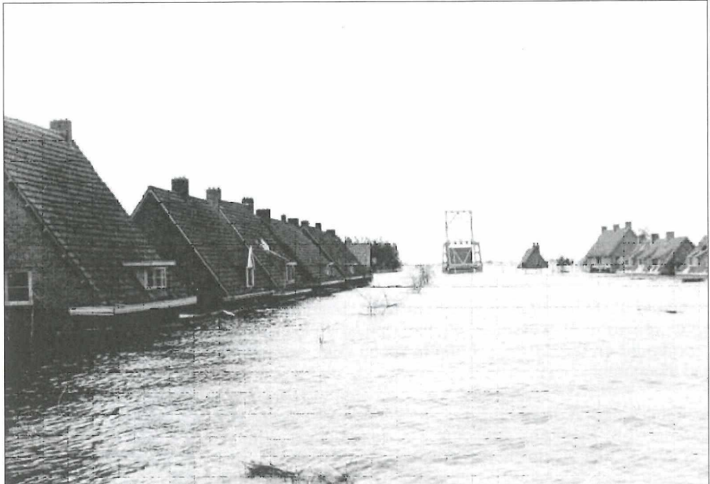
De Brugstraat staat onder water.

Inmiddels was de Tweede Wereldoorlog uitgebroken. Met de bevrijding vlak voor de deur, kwam er een zwarte bladzijde in de geschiedenis van onze polder, 17 april 1945. 's Middags om 12.00 uur lieten de Duitsers uit wraakzucht de polderdijk exploderen. Miljoenen m 3 water stroomden de polder binnen, toegelaten door twee gaten: één van 150 meter lengte en één van 200 meter lengte. Het eerste had een diepte van 30 meter, het andere van 23 meter.