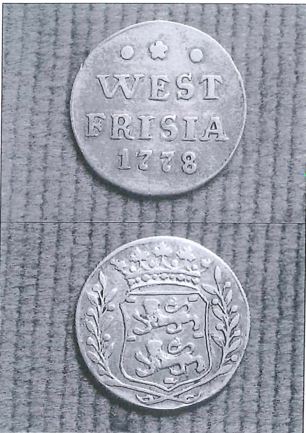
Afb. 1: Zilveren duit 1778.

Al jaren was het mij bekend dat er zilveren afslagen uit 1778 bestonden, van een normaliter bronzen duit. Betreffende munten zijn geslagen met een aangepast stempel uit 1769. Ik heb mij altijd afgevraagd waarom deze speciale zilveren duiten zijn geslagen.