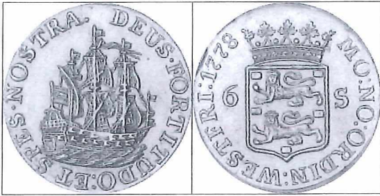
Afb.2: Gouden scheepjesschelling 1778.

De namen van de schepen zijn niet bepaald origineel namelijk: de Medemblik , de Enkhuyzen en de Hoorn . Met het fregat Medemblik werd gestart in 1778; de spannende tewaterlating vond plaats in 1779 met een grote schare toeschouwers.