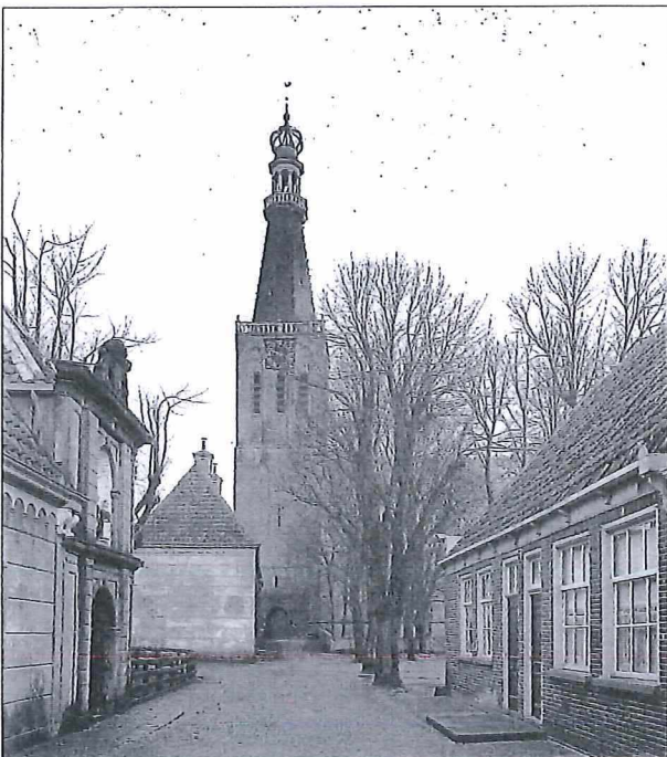
Afb.3: Ca. 1916, de Bonifaciuskerk en de Munt, gezien vanaf de Torenstraat.

Het zou kunnen zijn dat zowel de productie van de zilveren duiten als de gouden scheepjesschelling te maken hebben met deze belangrijke gebeurtenissen. Of het werkelijk zo is zal nog het nodige onderzoek vergen, want tot op heden is er nog geen sluitend bewijs.