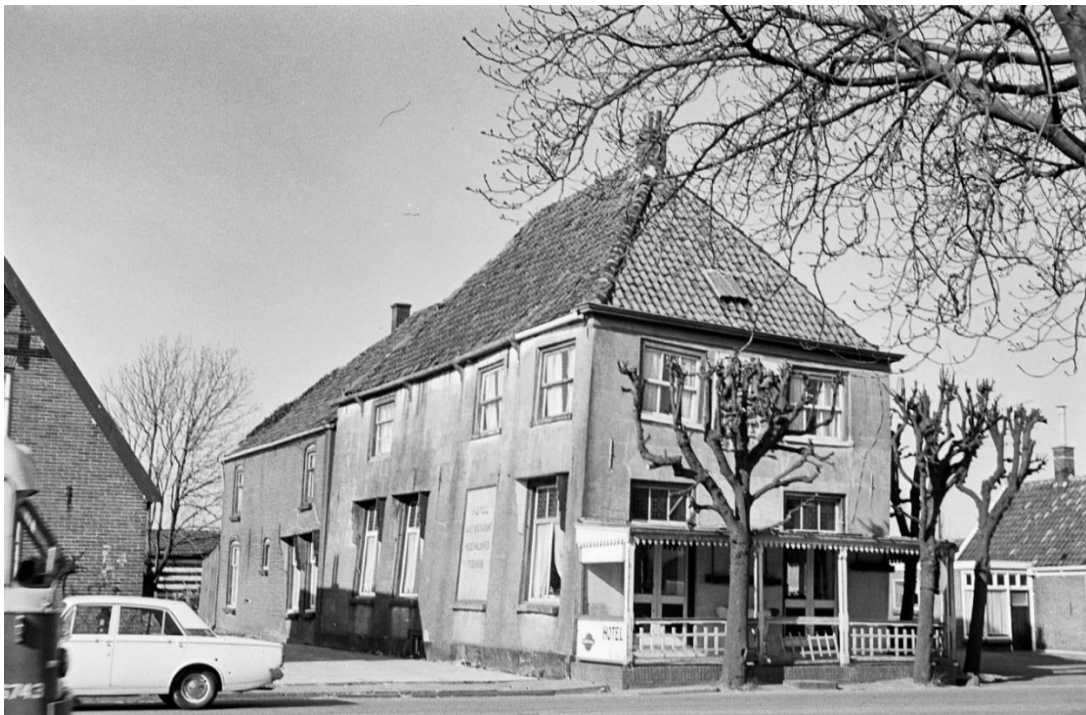
Het Medemblikker Tolhuis te Hoogkarspel in 1968. De wapenstein bevond zich tussen de twee bovenramen in de voorgevel.

Het tolhuis in Hoogkarspel brandde af in 1973. Het pand ging geheel verloren maar de wapenstein die de bouw in 1729 memoreert, werd gered.