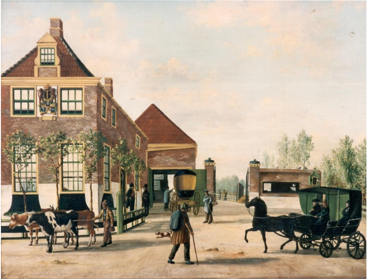
Het Medemblicker Tolhuis te Hoogkarspel, geschilderd door A.F. Kok in 1843. (Westfries Museum)