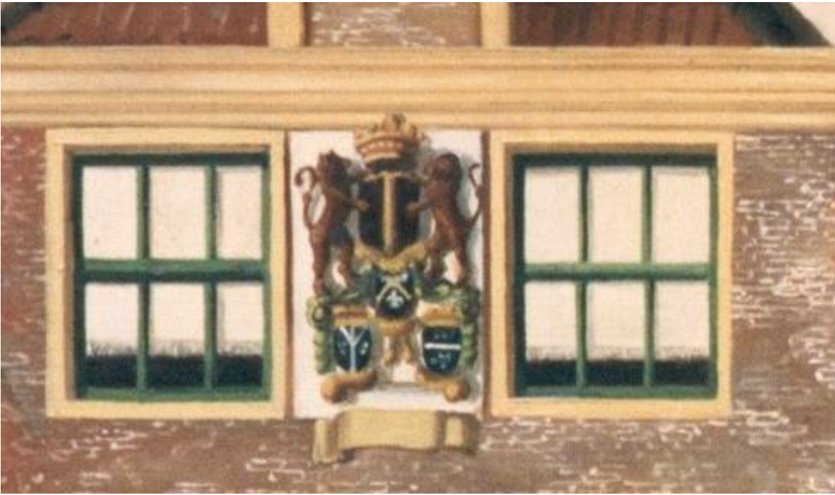
Detail van het schilderij.