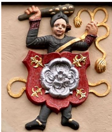
Een gevelsteen met het wapen van Schagen in Amsterdam.

De roos in het wapen is zeer waarschijnlijk een verwijzing naar de familie aan moederskant: Schagen. Het veld waarop de roos is geplaatst, hoort rood te zijn. De roos zelf is in het huidige gemeentewapen van Schagen van goud (geel). Maar in oudere wapens is de roos van Schagen zilver (wit).