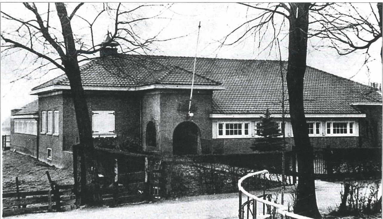
Afb.7: School met den Bijbel aan de Westersingel (ca. 1930).

Over het zingen van psalmen merkt Te Winkel nog op dat op een gegeven moment het zogeheten zingen op hele en halve noten in zwang kwam. Daarover is heel wat afgepraat of nu op de oorspronkelijke of de niet-oorspronkelijke wijze moest worden gezongen. Hetzelfde gold voor het lezen uit de oude dan wel de nieuwe Bijbelvertaling. 6 Van de kant van de gemeenteleden vinden we in het hetzelfde boekje onder het kopje 'Mijmeringen' de beleving van de andere zijde. Ze zijn opgeschreven door Wim Bakker.