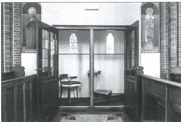
Afb. 1: Biechtstoel in de Martinuskerk (2021).

Een biechtstoel is een meubel dat in rooms-katholieke kerken wordt aangetroffen en waarin de biecht wordt afgenomen. Meestal bestaat de biechtstoel uit twee delen, gescheiden door een rooster of gordijn. Het is de bedoeling dat de biechteling anoniem blijft, zijn ruimte is dan ook duister zodat de priester hem niet kan herkennen. De priester zit aan de ene kant, de biechteling knielt aan de andere kant.