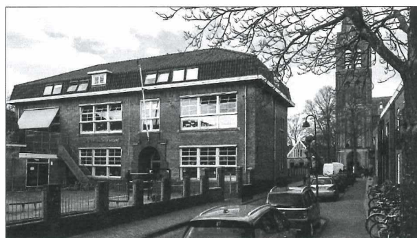
Afb. 2: Einde Bagijnhof met de voormalige Mariaschool (2021).

De geschiedenis leert het volgende. In het voorjaar van 1875 gingen twee heren van het Rooms-Katholieke Armbestuur naar Tilburg om te vragen of een paar Zusters van Liefde bereid waren in Medemblik een bewaarschool te beginnen. Ja, dat gebeurde. Op 5 mei 1884 werd door de zusters ook een Taalschool voor meisjes geopend.