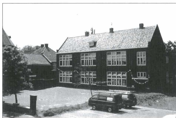
Afb.4: De St. Jozefschool in de Ridderstraat (1970).

Vervolgens stommelt iedereen naar binnen en loopt naar zijn klas.