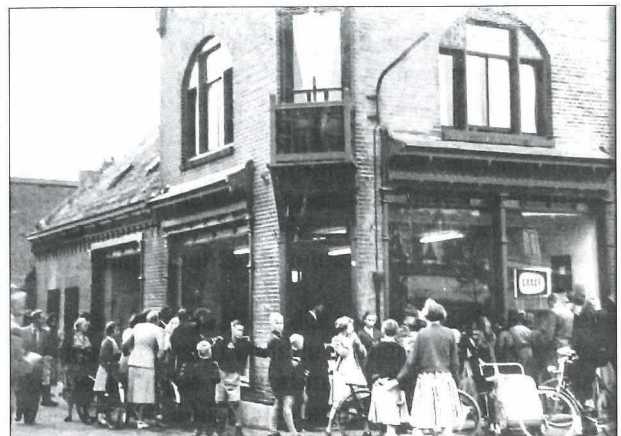
Afb. 6: De eerste televisietoestellen in de etalage van Radio Bood (ca. 1960).