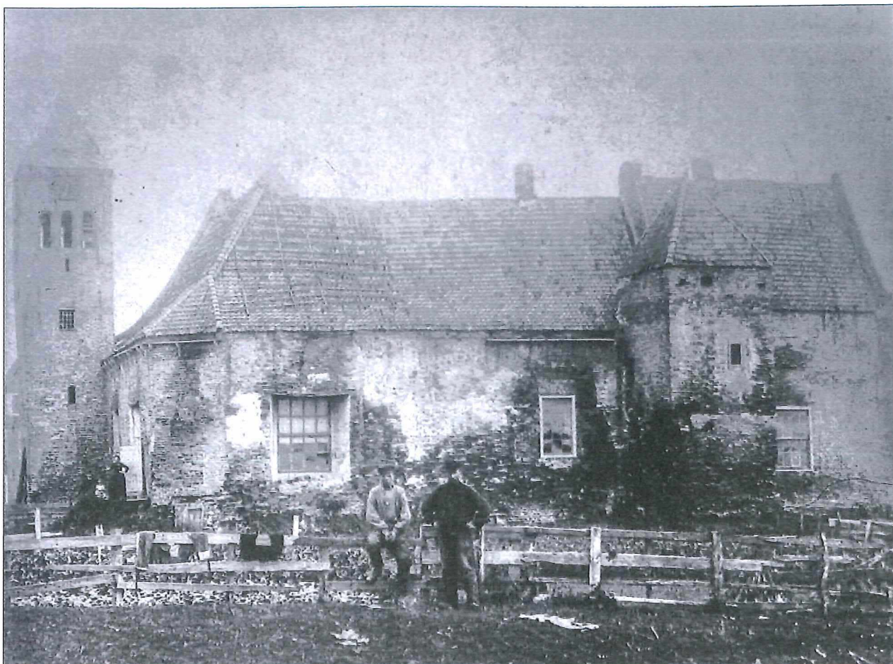
Afb:4: Het kasteel Radboud gezien vanuit het zuiden omstreeks 1880.

Davies wilde een foto zonder figuranten erop, maar zag dit plan in duigen vallen toen binnen een paar minuten kinderen toestroomden en op de brug over de gracht gingen staan. Het viel Davies verder op dat veel huizen in Medemblik waren voorzien van 'spionnetjes'. Een gebruik waar hij echter ook vanuit East-Anglia mee bekend was.