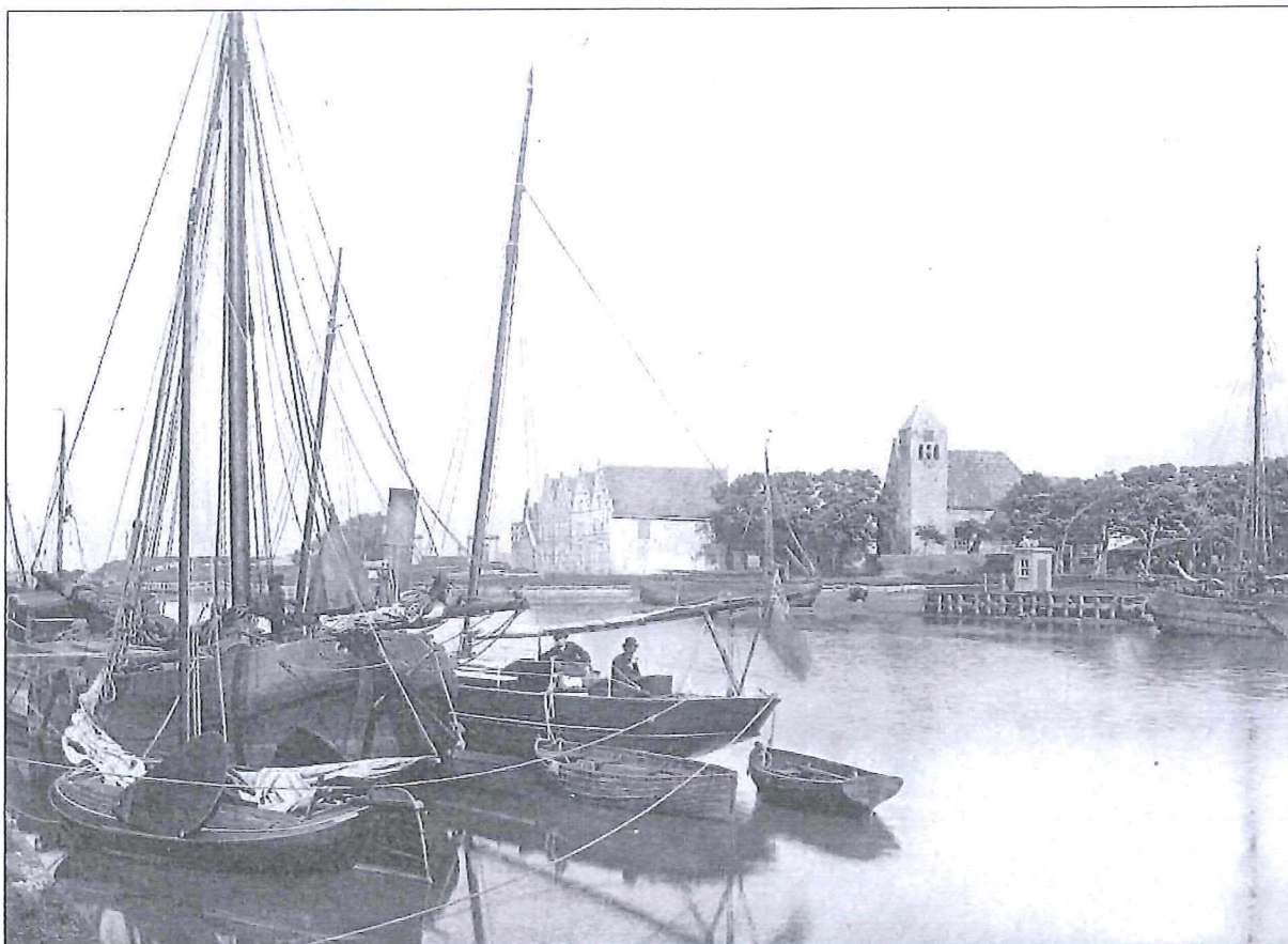
Afb.1: 1 juni 1886, het stoomzeilschip Atalanta ligt afgemeerd in de Oosterhaven met twee opvarenden op het achterdek.

De Engelsman maakt melding van een kamer in het stadhuis waar de wanden voorzien zijn van bewerkte en geschilderde leer die oud en bijzonder mooi was. Het meest interessante object dat hij aantroef was een koperen plaat, gedateerd 1599 en duidelijk voorzien van een gegraveerde kaart van Medemblik.