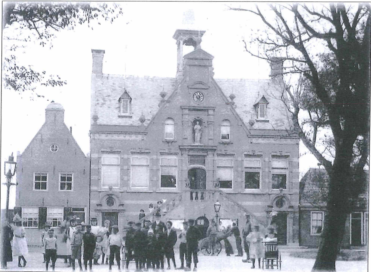
Afb.2: Het oude stadhuis omstreeks 1900.

De stad zelf, oogt volgens Havard nauwelijks opgewekter of levendiger dan het voormalige instituut. Hij noemt het een klein evenement als een paar vreemdelingen door de verlaten straten wandelen. Havard voelt zich begluurd van achter de horretjes en de witte vitrage.