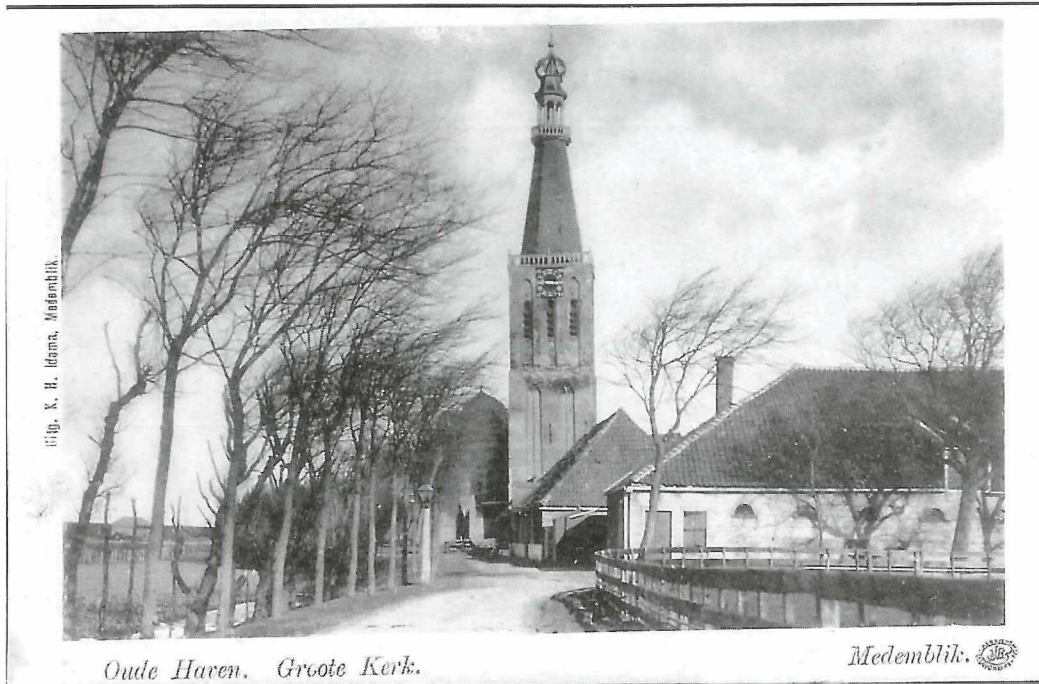
Uitg. K. H. Idema, Medenblik