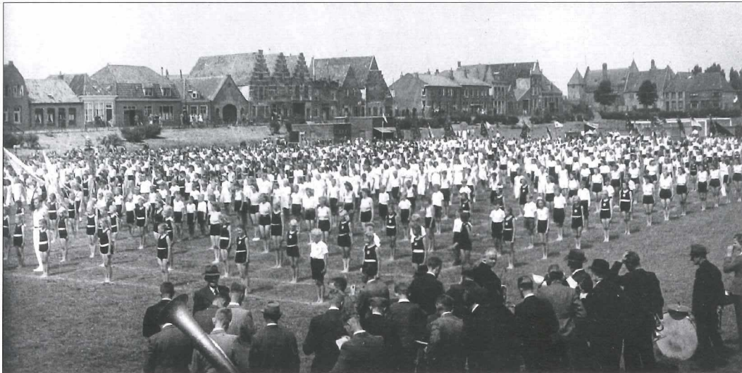
Afb. 1a: Het in 1947 gehouden tuinfeest van gymnastiekvereniging OSS in de Pekelharinghaven.

Ook dit keer nemen wij u weer mee naar de verschillen van toen en nu, met behulp van mooie foto's; oude uit het archief en nieuwe onlangs gemaakt.