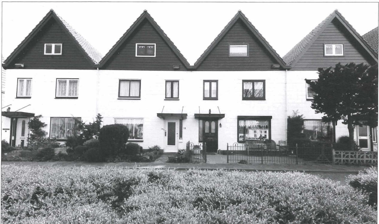
Afb.9b: Dezelfde huizen anno 2017.

In het meest linkse huis woonde de familie Pruim, verpleger op het provinciaal ziekenhuis.