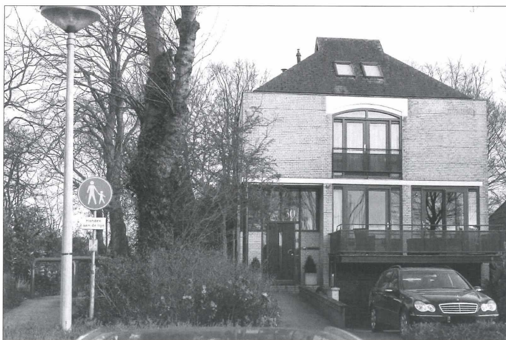
Afb.10b: De zuidoosthoek anno 2017.