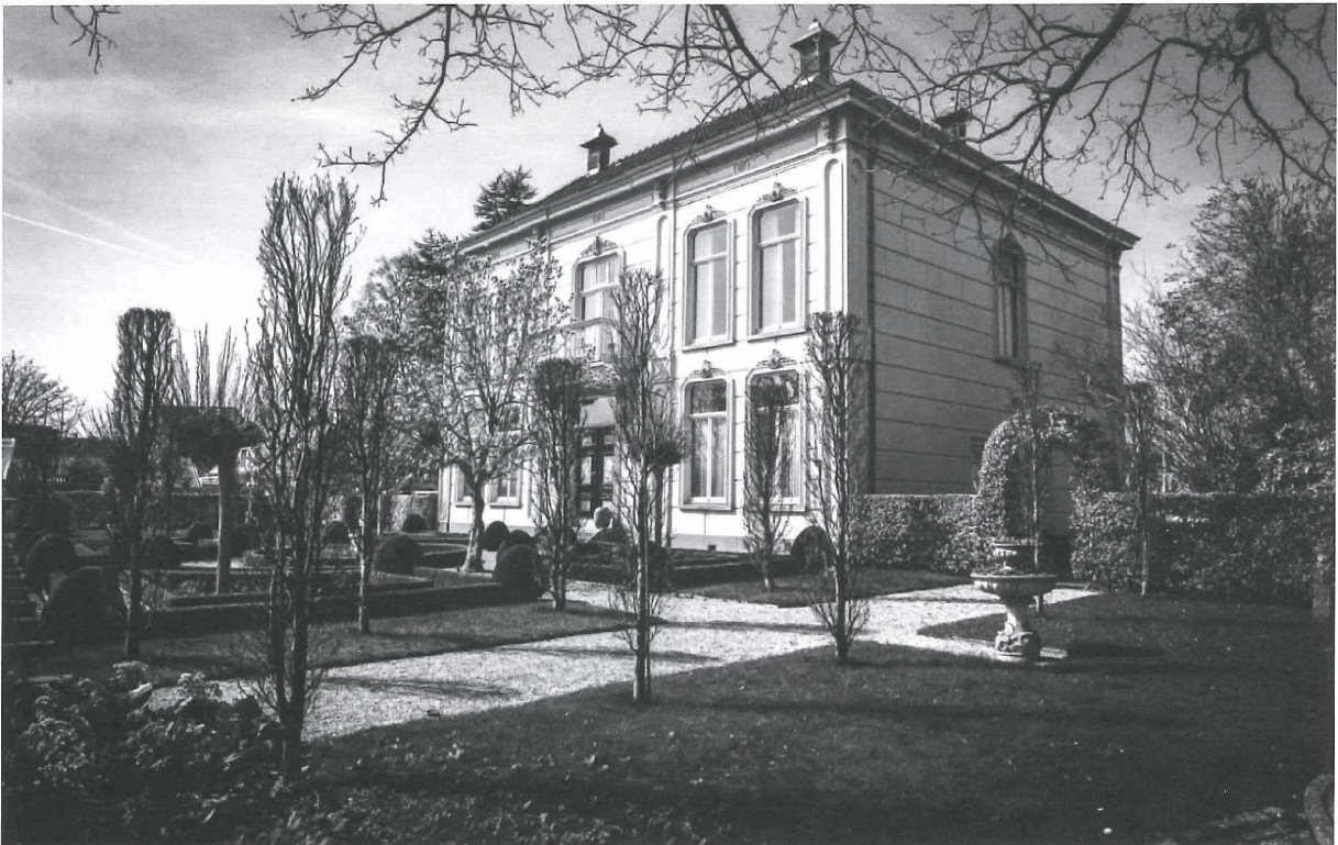
Afb.3b: Eilandstaete anno 2017.

Later is het de woning geweest voor achtereenvolgens de geneesheer-directeur van het provinciaal ziekenhuis, de tandarts en de burgemeester.