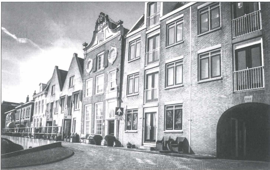
Afb. 6b: Het Vooreiland anno 2017.