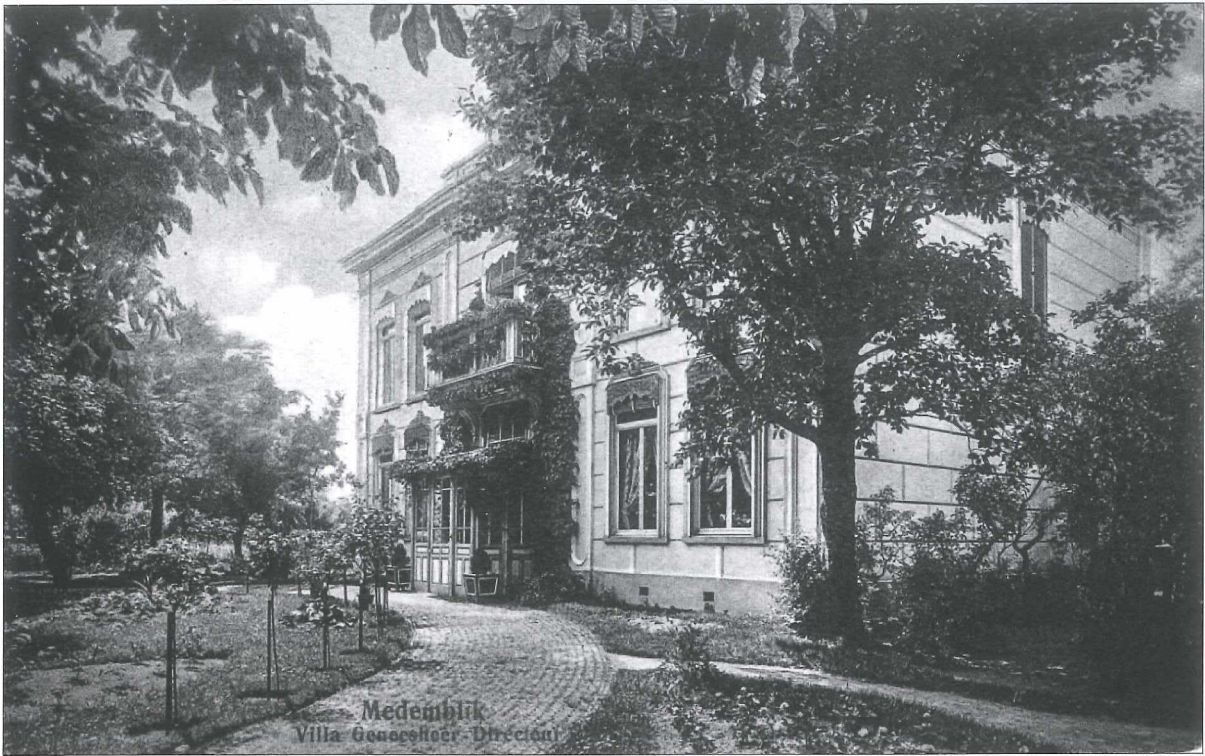
Afb.3a: Eilandstaete omstreeks 1910.

Het herenhuis is gebouwd voor de kaashandelaren uit Harlingen.