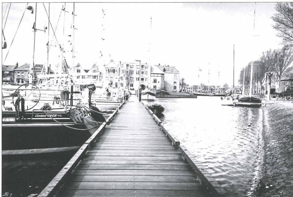
Afb.7b: De 'natte' Pekelharinghaven anno 2017.

Rechts de kantine van MFC. Toen deze afbrandde, ontplofte er een gasfles; dat maakte grote indruk op de schrijver, die toen bij de vrijwillige brandweer was.