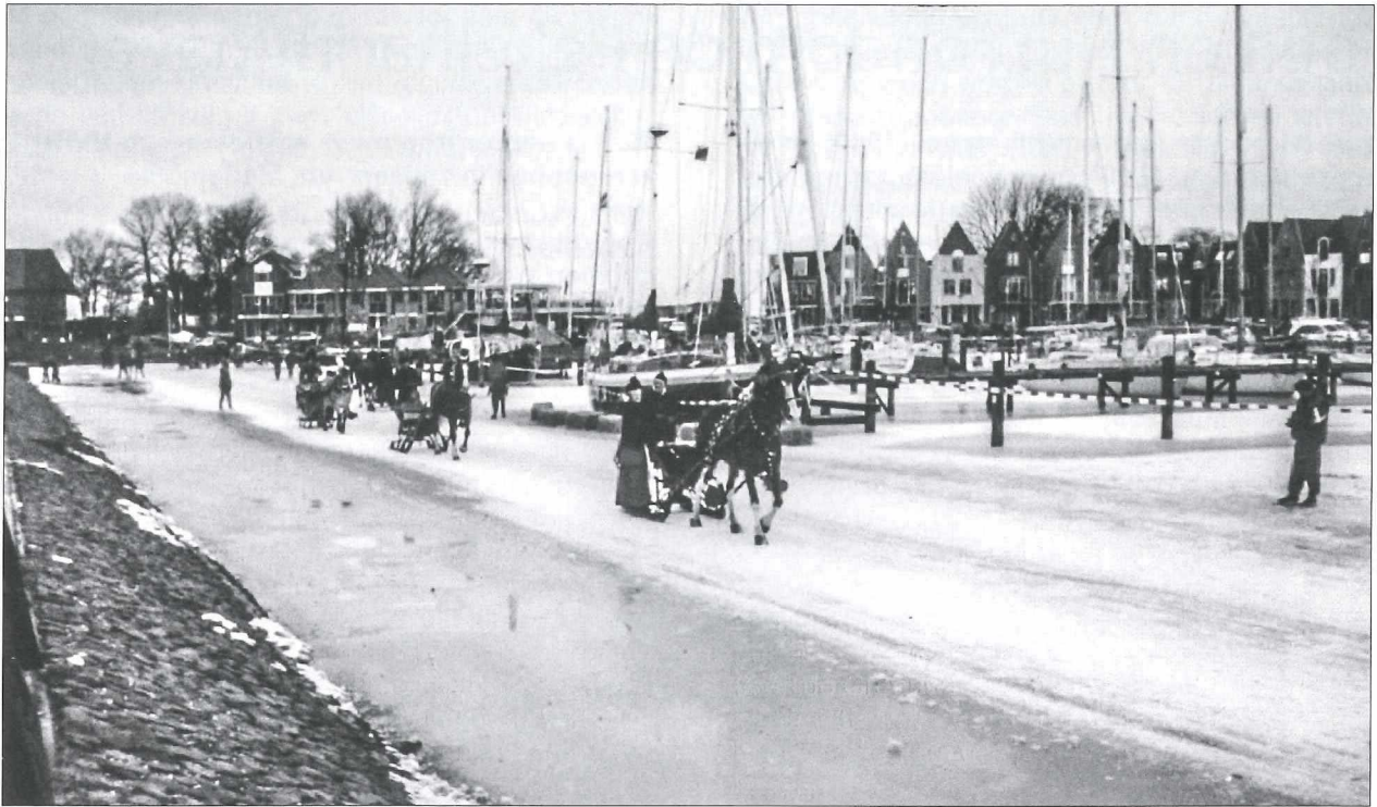
Afb.2a: Omstreeks 1995: een wedstrijd arrensleden rijden op de dichtgevroren Pekelharinghaven.

Arrensleden en daarbij ook hardrijden en schoonrijden, nu op de Pekelharinghaven met diverse toeschouwers, ondanks de kou.