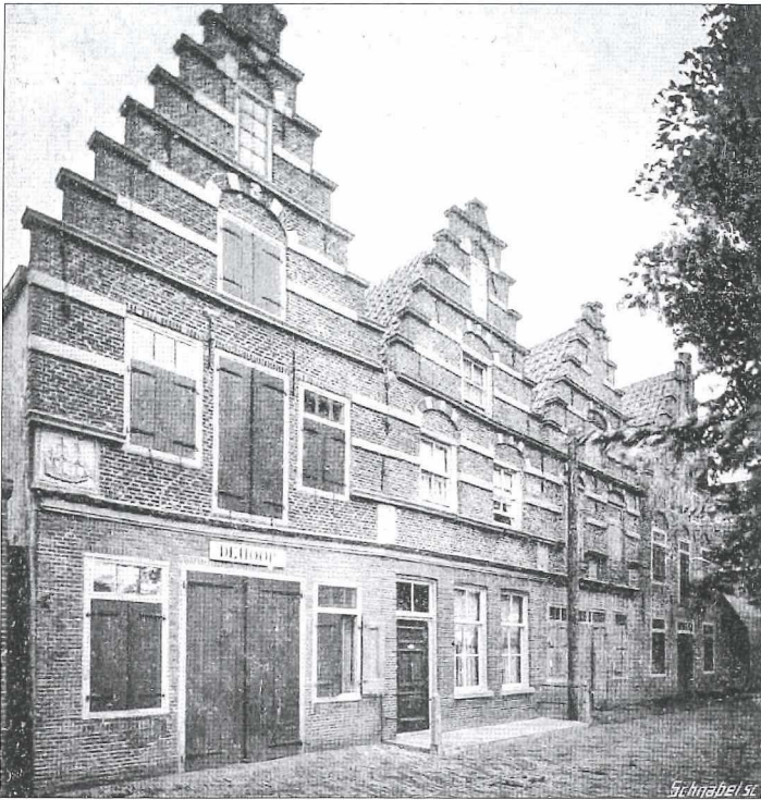
Afb. 4a: Voormalige pakhuizen aan het Vooreiland (1917).

Aan het Vooreiland stond een groep van vier verpauperde huizen. Deze huizen werden veelal gebouwd met zeer zware zolderbalklagen waar de scheepvracht van de binnen gekomen schepen opgeslagen werd.