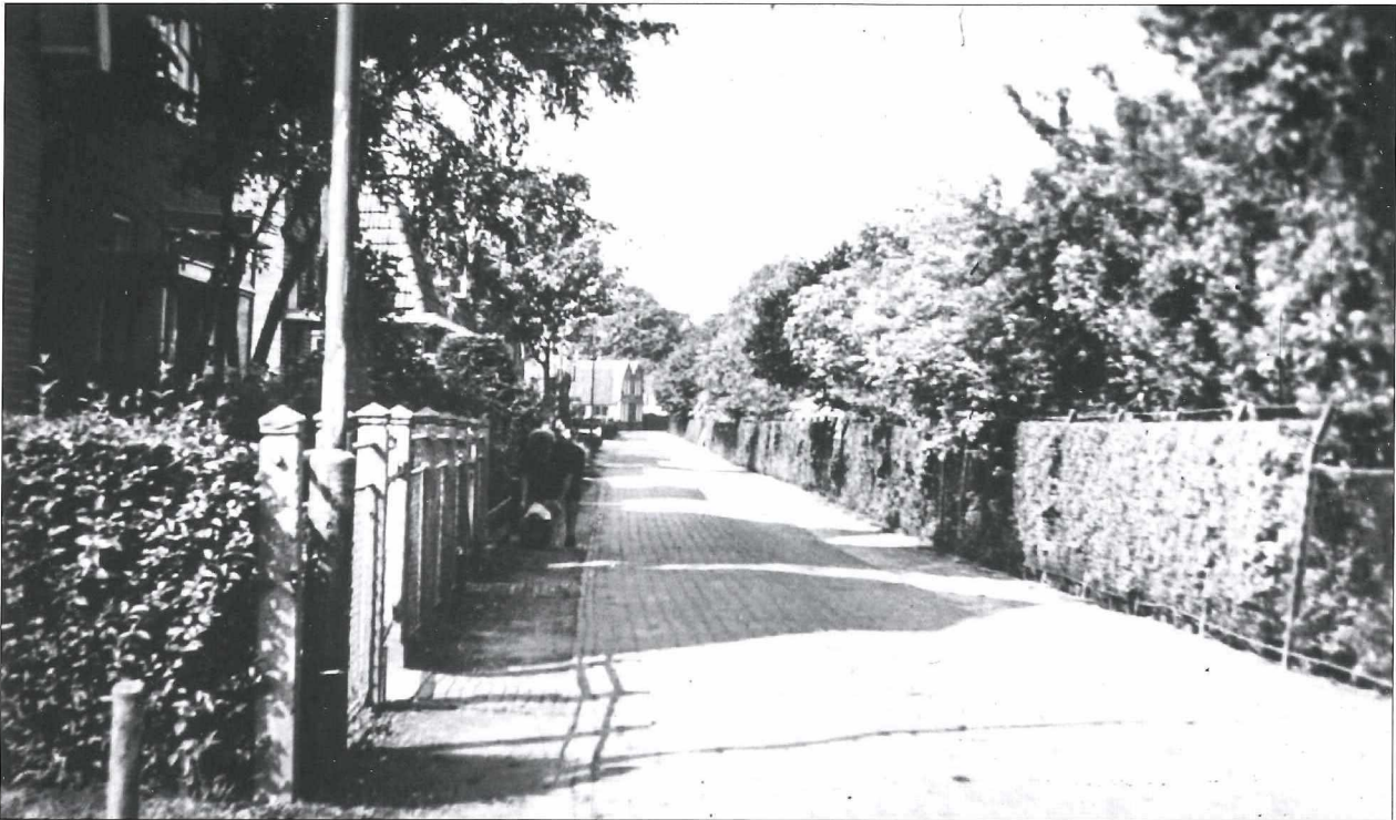
Afb.8a: De Pekelharinghaven omstreeks 1960.

Het voetbalveld werd aan alle zijden afgesloten met een dichte haag van bomen en struiken.