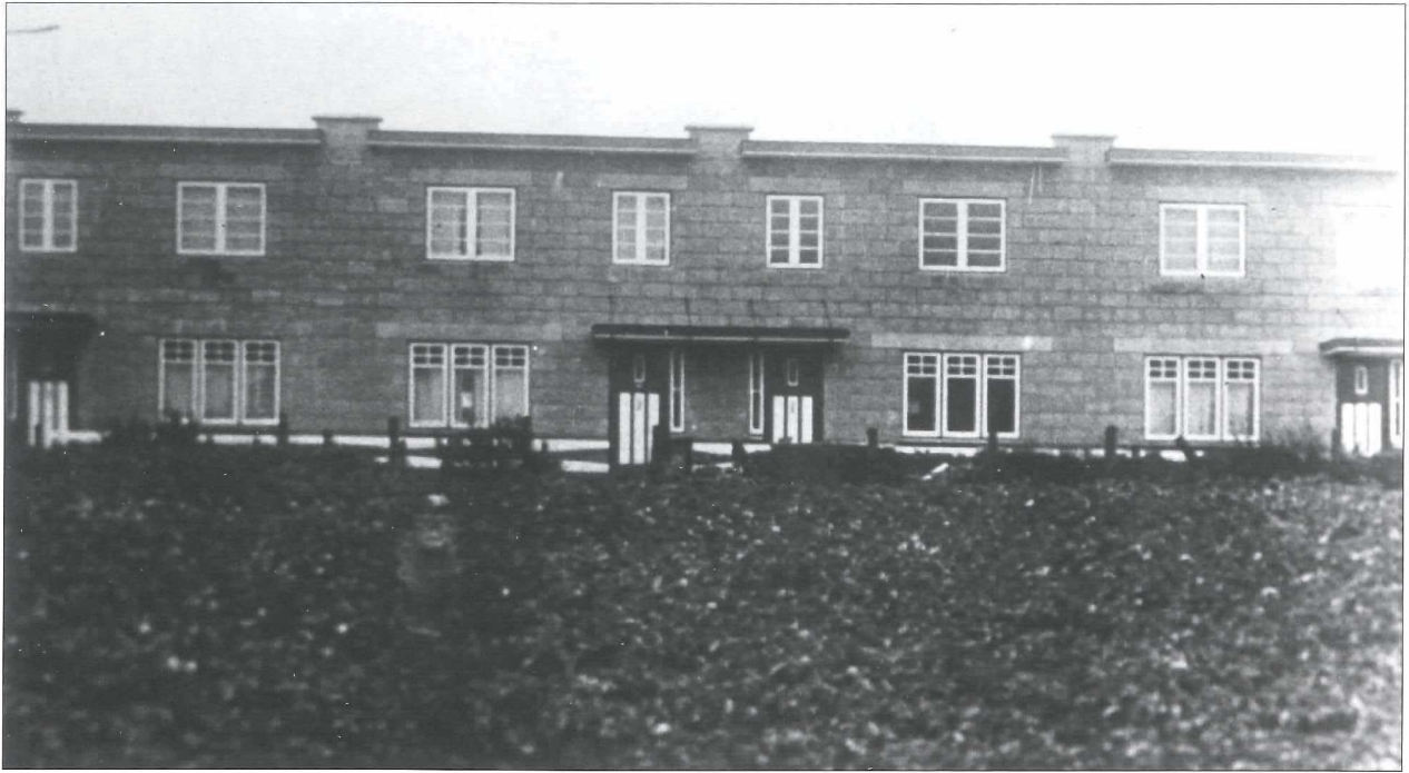
Afb.9a: De huizen aan de Pekelharinghaven omstreeks 1950.

De zgn. “betonhuizen” schenen nogal vochtig te zijn vanwege de massieve muren en de platte daken.