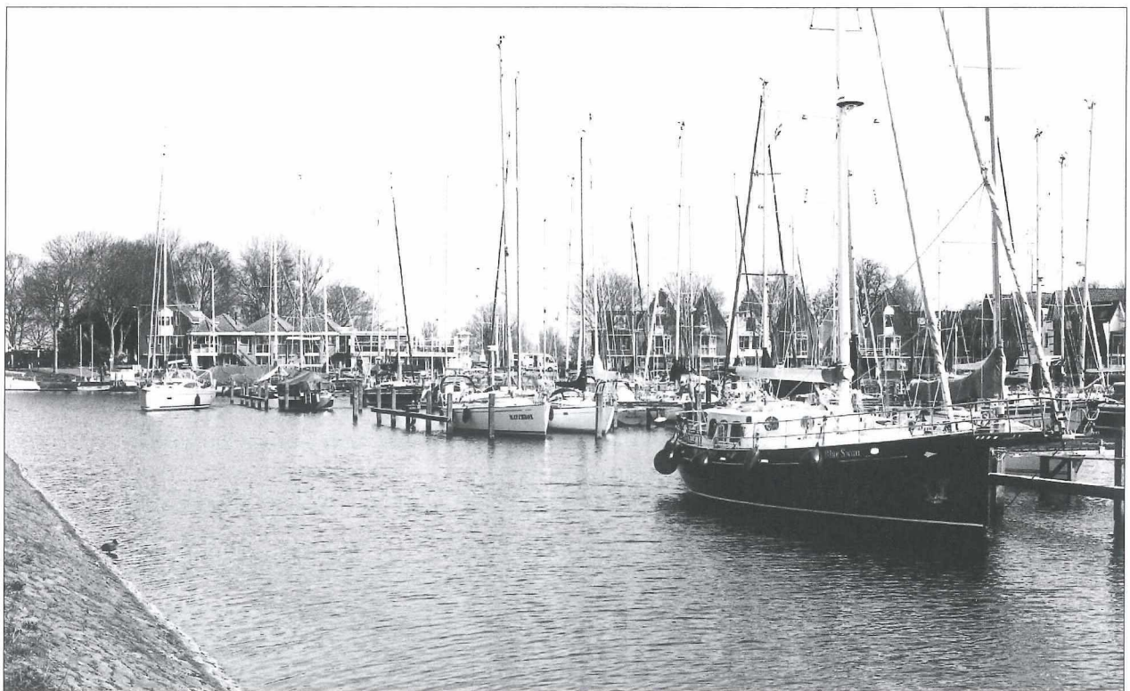
Afb.2b: Pekelharinghaven voorjaar 2017.

Arrensleden en daarbij ook hardrijden en schoonrijden, nu op de Pekelharinghaven met diverse toeschouwers, ondanks de kou.