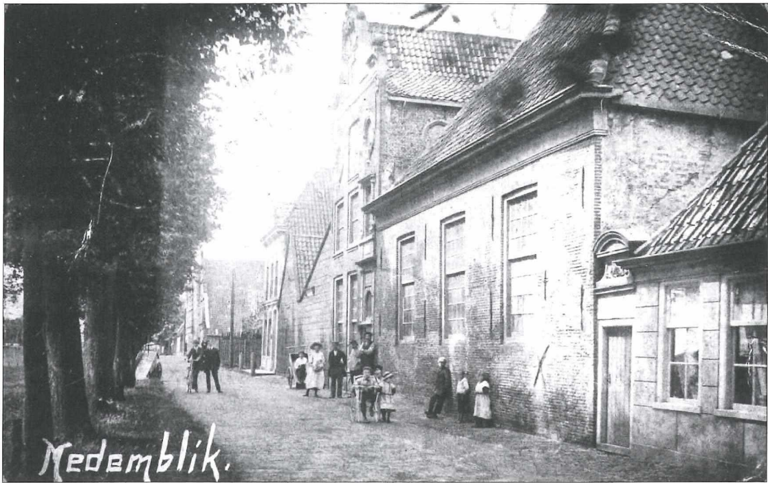
Afb. 6a: Het Vooreiland omstreeks 1918 (aldus het poststempel).

Hier zien we het mooie huis van Veen dat in de Gouden Eeuw gebouwd is. Ze hadden wel iets met turf te maken, aangezien op het wapen boven aan de gevel een stapel turf te zien is, met daar achter het wapen van Medemblik. Op het poortje op de voorgrond is het zelfde wapen te zien. (Dit wapen boven het poortje vindt u terug boven een steeg in de zuidoosthoek van de Pekelharinghaven).