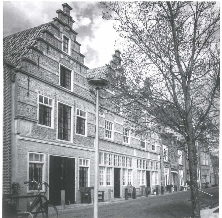
Afb. 4b: De voormalige pakhuizen anno 2017.

Maar de twee middelste gevels mogen gezien worden. Ook de naam Geloof, Hoop en Liefde voor de huizen lijkt hier en daar nog bekend bij de Medemblikkers.