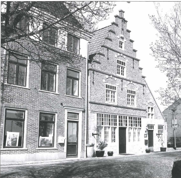
Afb.5b: Pakhuis De Wolf anno 2017.

Pakhuis De Wolf werd onder leiding van ar- chitectenbureau Vlaming gerestaureerd tot woonhuis; een knap staaltje. Het huis er- naast was eerst een restaurant annex hotel, maar krijgt nu een woonbestemming.