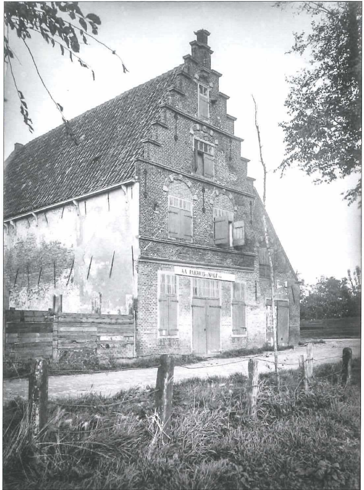
Afb.5a: Pakhuis De Wolf anno 1924.

Tot de restauratie werd dit pakhuis gebruikt voor opslag van materialen voor de Bescherming Be- volking.