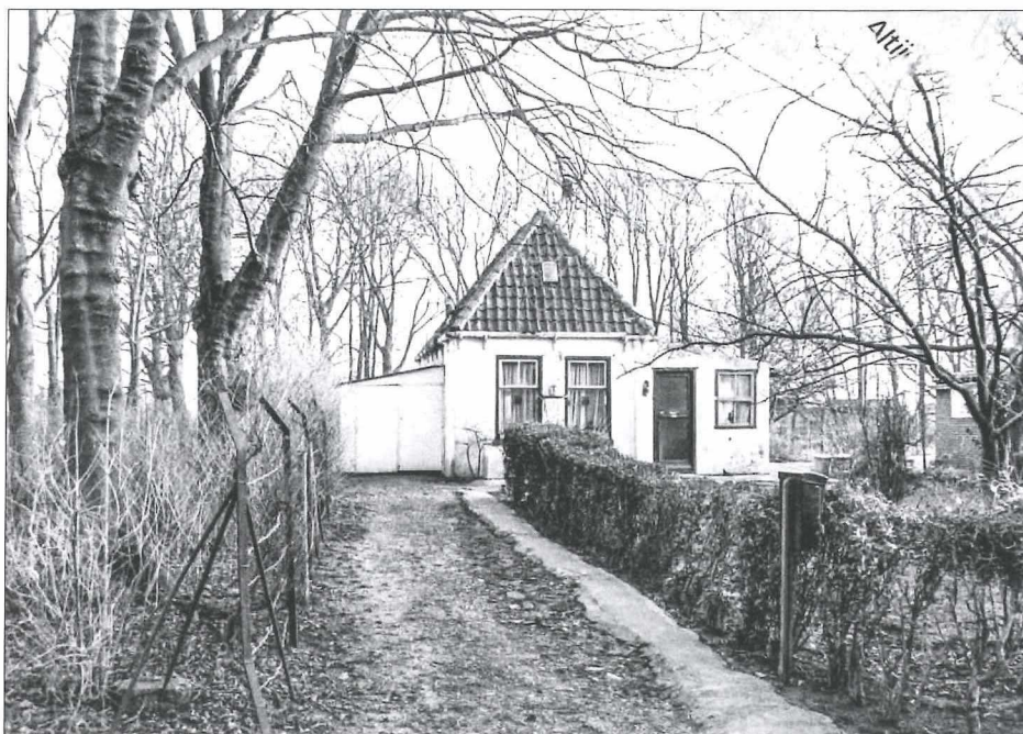
Afb.10a: De zuidoosthoek van de Pekelharinghaven anno 1984.