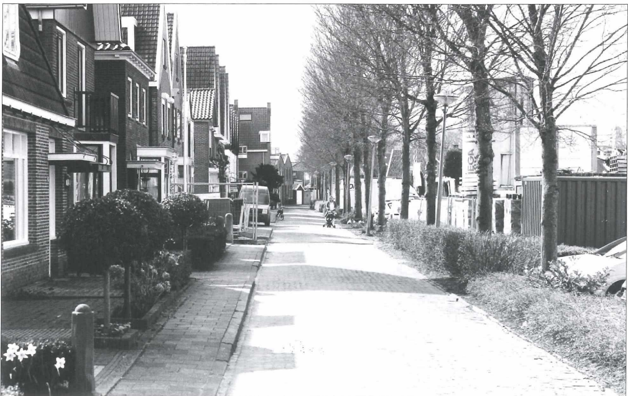
Afb.8b: De Pekelharinghaven anno 2017.

Dit met het oogmerk dat er geen niet-betalende kijkers de voetbalwedstrijden zouden kunnen volgen.