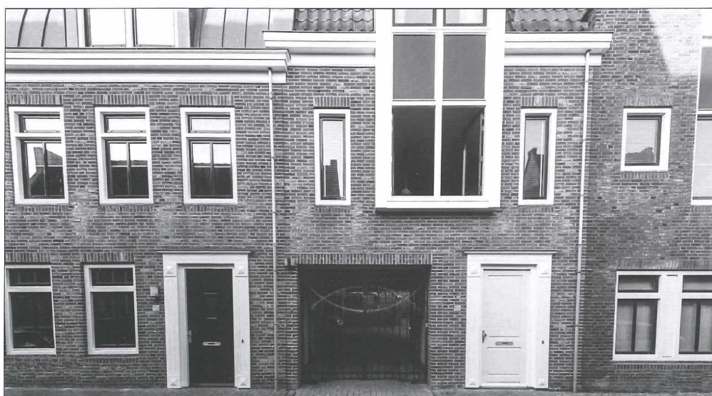
Afb.2b: De Kruisstraat zomer 2018.

Wat nu een bekende jaarlijks terugkerende activiteit op alle scholen is, het nemen van de klassenfoto, moet rond 1900 wel iets bijzonders zijn geweest. Waarschijnlijk was het voor velen de eerste keer dat de kinderen op de foto gingen!