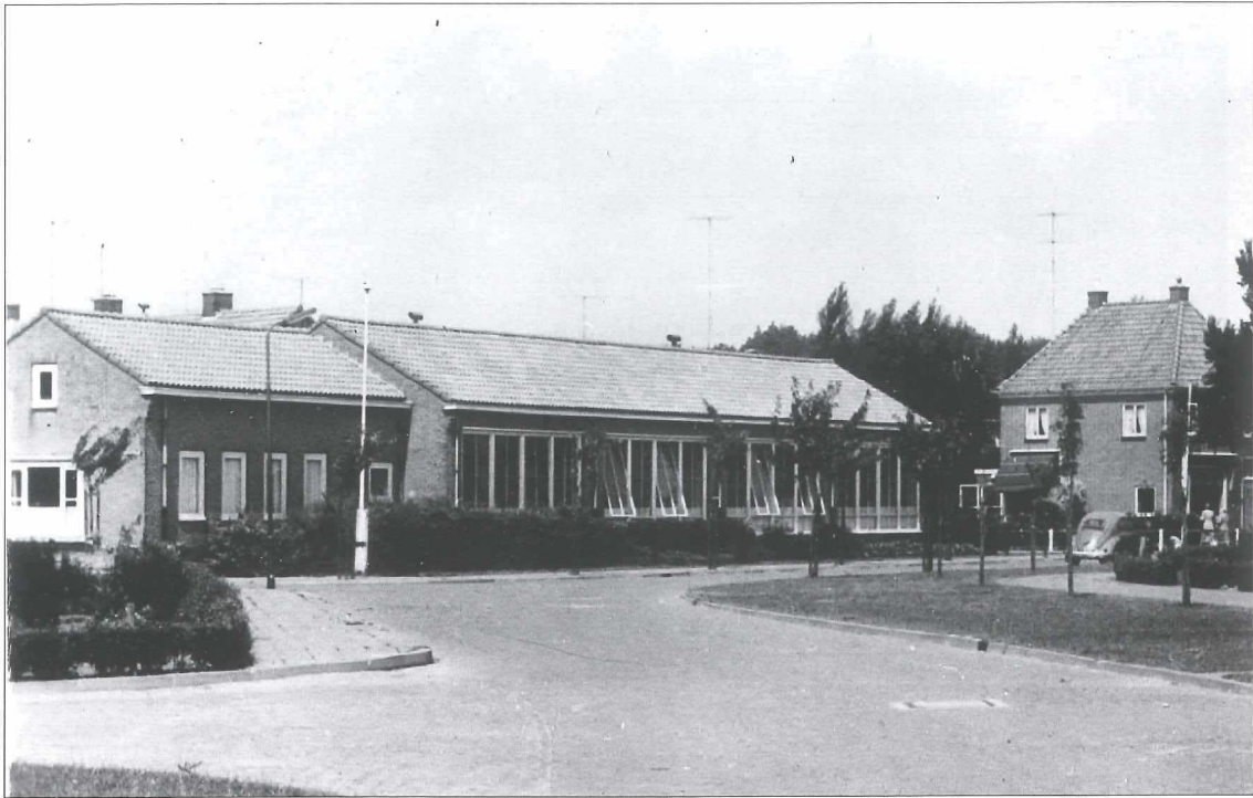
Afb. 12a: De ulo op de hoek van de Hauwertstraat en de Graaf Florislaan in 1961.

De start van de bouw van deze school vond plaats in 1953. Het ontwerp is eenvoudig en functioneel met weinig opvallende details. Reeds veel eerder beschikte Medemblik al over een openbare ulo-school.