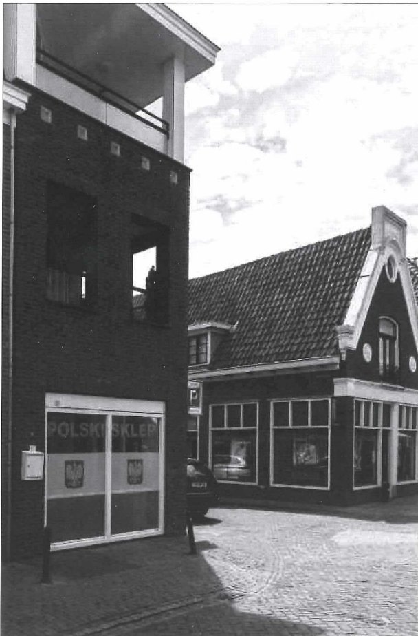
Afb.6a: Een verbouwing ten behoeve van twee lagere scholen hoek Bagijnhof/Kruisstraat in 1921.

De oorspronkelijke gevel is nauwelijks herkenbaar door de aangebrachte veranderingen. Het hoekpand doet qua maat en schaal toch wel wat vreemd aan voor de binnenstad van Medemblik.