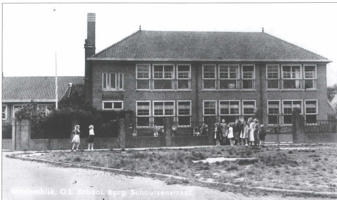
Afb. 10a: De openbare lagere school in Plan West anno 1949.

De in 1932 opgeleverde school (ook een ontwerp van architect P.W. Vlaming) bestaande uit twee bouwlagen en zes lokalen plus een lager deel aan de zuidzijde.