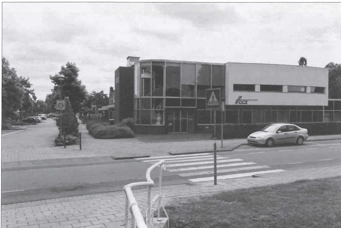
Afb. 8b: De voormalige locatie van de School met den Bijbel anno 2018. Het voormalige politiebureau is nu in gebruik door de GGZ Stichting PSYA.