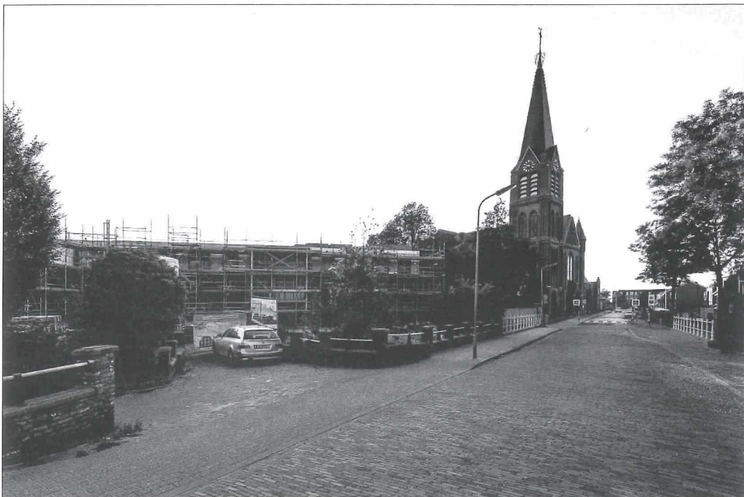
Afb.3b: De plaats van de Aloysiusschool anno 2018.

Deze konden toen de openbare lagere school inruilen voor deze school op religieuze basis. Het onderwijs werd verzorgd door de fraters.