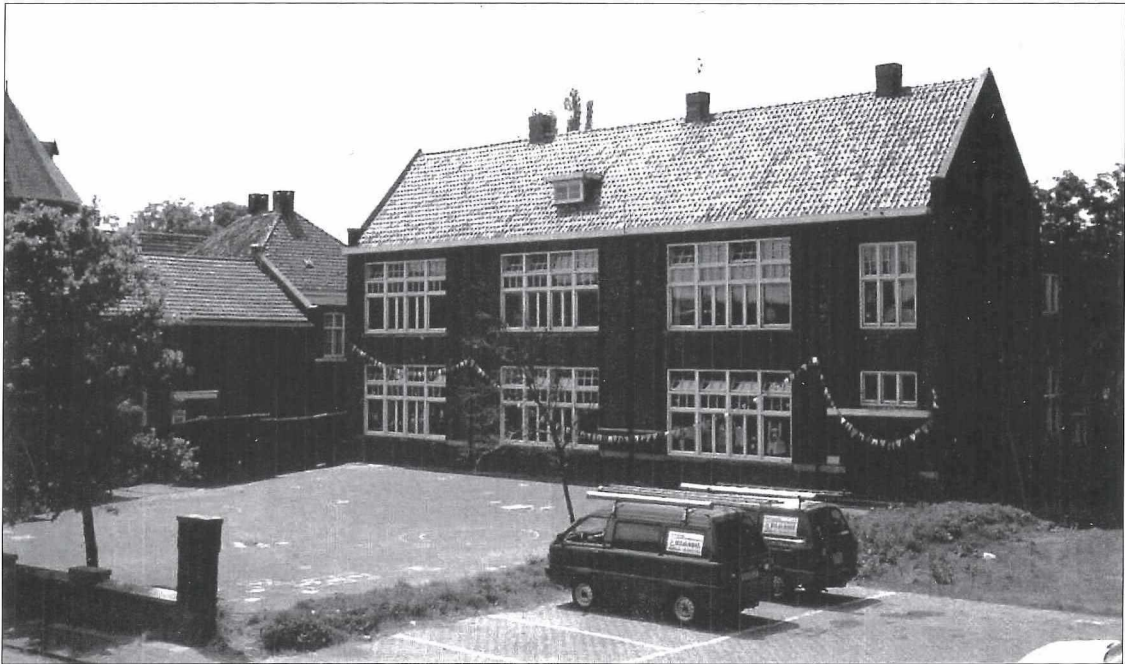
Afb.9a: De in 1928 nieuw gebouwde Jozefschool aan de Ridderstraat omstreeks 1980.

De eerder gebouwde Aloysiusschool werd op een gegeven moment te klein en daarvoor in de plaats werd in augustus 1928 begonnen met de bouw van de St. Jozefschool aan de Ridderstraat. Ook hier werd het onderwijs door de fraters verzorgd.