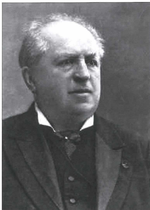
Afb. 1: Abraham Kuyper (1837-1920).

De geschiedenis van de vrijheid van onderwijs is anders verlopen dan velen denken.