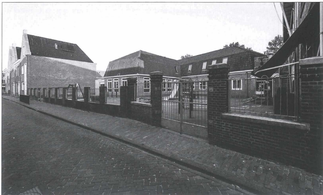
Afb.5b: De voormalige plek van de Mariaschool anno 2018.

Hiertoe werd vanuit Medemblik een beroep gedaan op de zusters van Liefde uit Tilburg. In 1884 was het zover en kon de Bewaarschool worden ondergebracht in het pand van het Martinusgesticht aan het Bagijnhof.