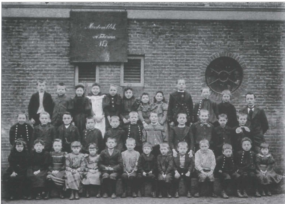
Afb.2a: Eén van de oudste schoolfoto's. We zien een klassenfoto van de openbare lagere school aan de Kruisstraat (1890).

We beginnen ons 'beeldverhaal' met de oudste foto's van de scholen in Medemblik. Die dateren van rond 1900.