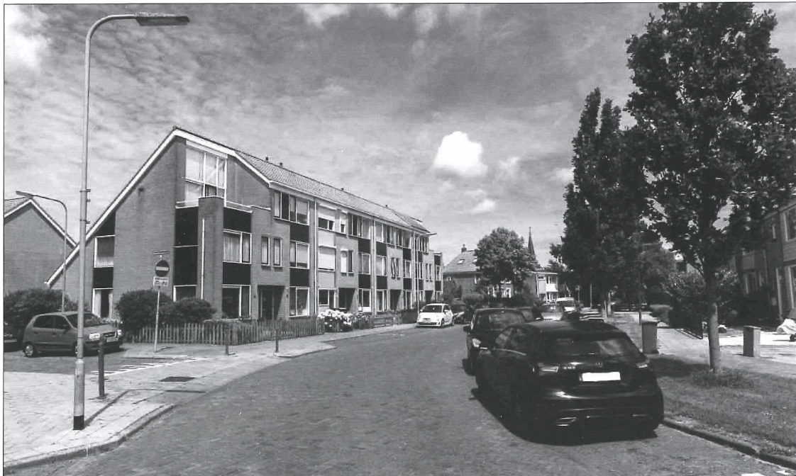
Afb. 12b: De plek van de voormalige ulo anno 2018.

Een krantenbericht van 21 november 1930 maakt bijvoorbeeld melding van het feit dat de openbare ulo-school van Medemblik werd gesloten omdat de twee vacatures (meer leerkrachten waren niet aan deze school verbonden) niet tijdig vervuld konden worden.