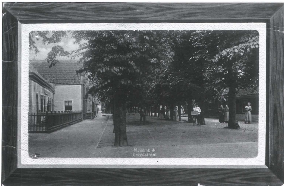
Afb.4a: De Nuts Bewaarschool omstreeks 1907.

De Bewaarschool was gevestigd aan de Breedstraat en was gesticht door de Maatschappij tot Nut van 't Algemeen.