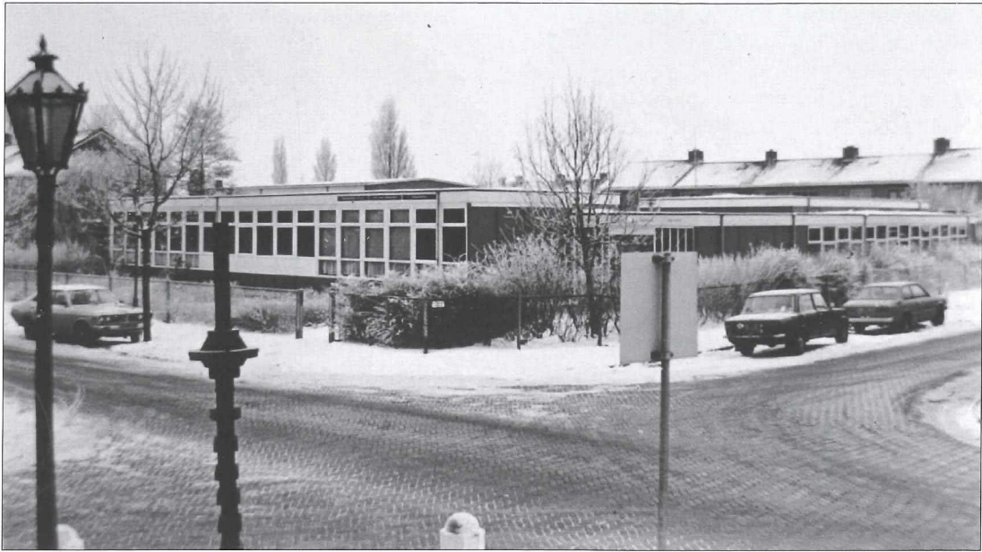
Afb. 13a: De mavo op de hoek Meerlaan/Uiverstraat omstreeks 1975.