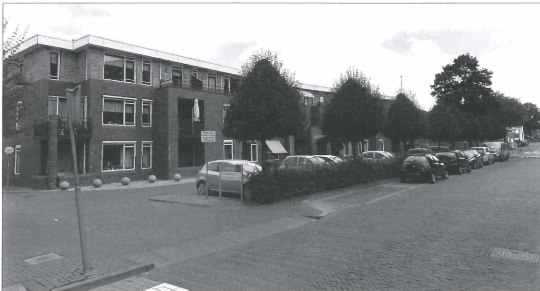
Afb.7b: De oostzijde van de Ridderstraat anno 2018 met het woonzorgcomplex Valburg op de plaats van het verdwenen pensioonaat.

Dit onderwijs werd in internaatverband gegeven. Het pand hiervoor wordt in 1907 opgericht aan de Ridderstraat. De fraters uit Tilburg verzorgen het onderwijs. Na enige tijd is het pand vergroot en kwam er ook een tweede verdieping op. De Ridderstraat van 1910 had een bijna landelijk karakter zoals op de foto valt te zien.