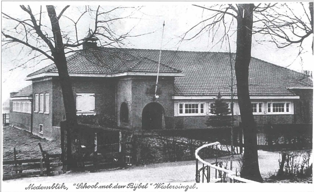
Modemblik, "School met den Bijbel" Westersingel.