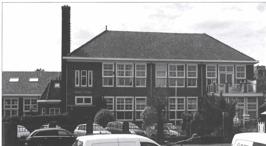
Afb. 10b: De voormalige openbare lagere school in Plan West anno 2018.

Het schoolplein, zoals bij nagenoeg alle scholen uit die tijd, voorzien van een duidelijke scheiding met de omliggende openbare ruimte. De aanbestedingsadvertentie van 13 juli 1931 repte overigens van de bouw van "zeven lokalen en verdere aanhoorigheden".