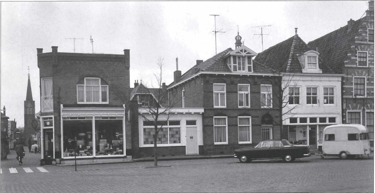
Afb. 11a: De voormalige dokterswoning van De Kruij met de praktijk (in laagbouw) omstreeks 1965.

Zie het pand op afb. 11a met de witte deur. Vanwege een doorzettende groei van het aantal leerlingen wijkt Winnubst in 1954 uiteindelijk uit naar Hoorn. Een mooi beeld van de westzijde van de Nieuwstraat. Radio Bood op de hoek en een kapperszaak in het pand met de witte gevel. Nieuwstraat 30 is hier in gebruik als burgermeesterwoning. De TV-antennes toentertijd nog prominent op de daken aanwezig. Parkeren in het centrum van Medemblik was toen nog geen probleem!