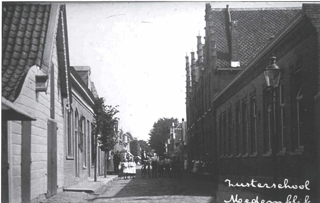
Afb.5a: De Mariaschool in het Bagijnhof omstreeks 1915.

De laagbouw rechts op de foto, met aansluitend het Martinusgesticht met de opvallende trapgevels, vormde de Mariaschool. Hier begonnen in 1884 de Zuster van Liefde hun onderwijsactiviteiten. Reeds in 1875 waren er initiatieven genomen om een rooms-katholieke kleuterschool te stichten.