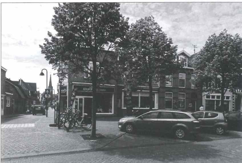
Afb. 11b: Het pand Nieuwstraat 30 anno 2018.

De westzijde van de Nieuwstraat anno 2018. Het tweede pand vanaf de hoek met het Bagijnhof is al geruime tijd bij de zaak van Radio Bood betrokken, tevens is het vergroot met een kap inclusief twee dakkapellen. De pui heeft ten behoeve van winkelfunctie ook een forse verandering ondergaan.