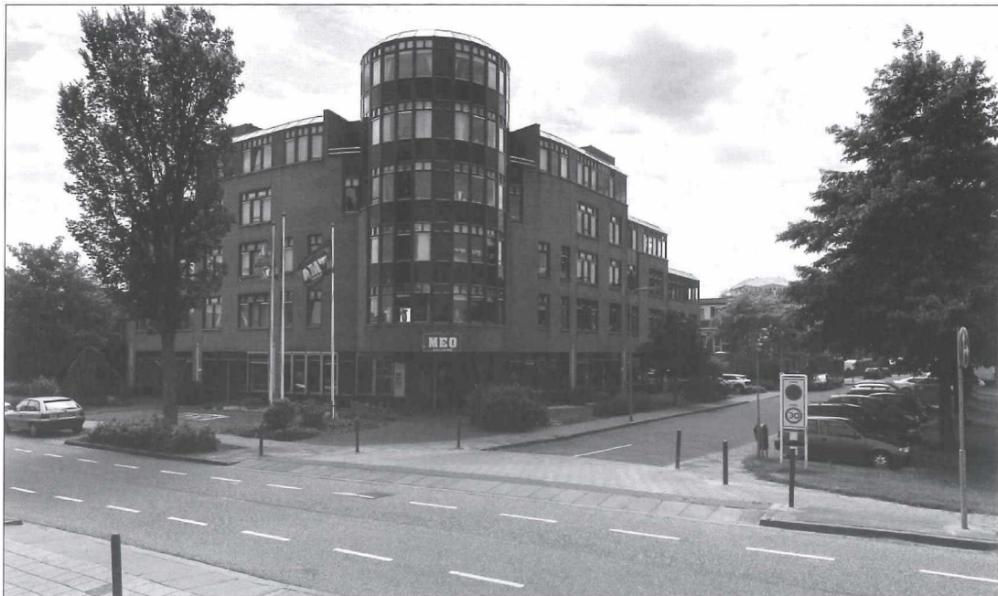
Afb. 13b: De hoek Meerlaan/Uiverstraat anno 2018.

De foto lijkt te zijn genomen vanaf de trap van het voormalige veilingkantoor van veilingvereniging Medemblik en Omstreken. Ook maakte de mavo gebruik van de voormalige ulo aan de Hauwertstraat/Graaf Florislaan.