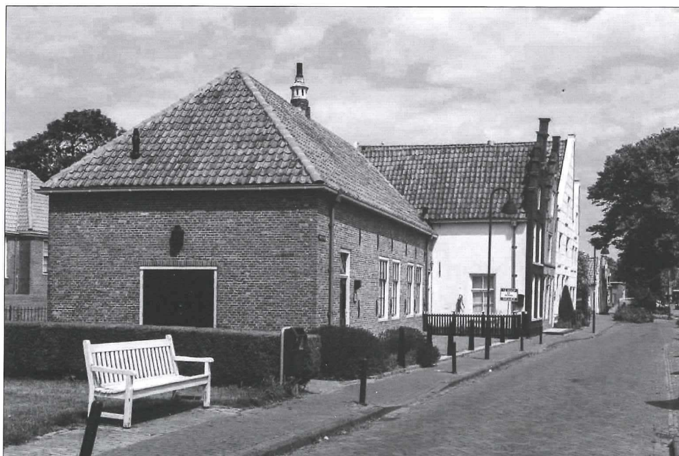
Afb.4b: De plek van de voormalige Bewaarschool anno 2018.

Vele Medemblikkers zullen hier hun eerste schooljaren hebben doorgebracht. De gedempte gracht heeft hier bijgedragen aan een mooie verstilde openbare ruimte.