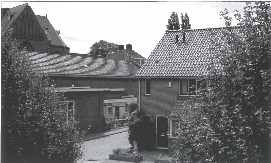
Afb.9b: Dezelfde locatie maar dan in 2018.

We zien op de foto een traditioneel bakstenen schoolgebouw in twee bouwlagen met een forse zolder. Het ontwerp was van onze stadsgenoot P.W. Vlaming. Wat een bouwkundig verschil met de School met den Bijbel!