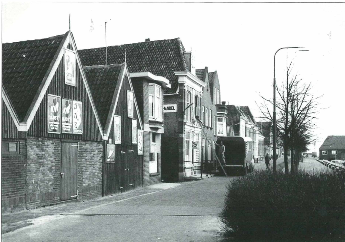
Gecorrigeerde Afb.7a: Links de pakhuizen van brandstoffenhandel Bijlsma aan de Oosterhaven (22-4-1963).