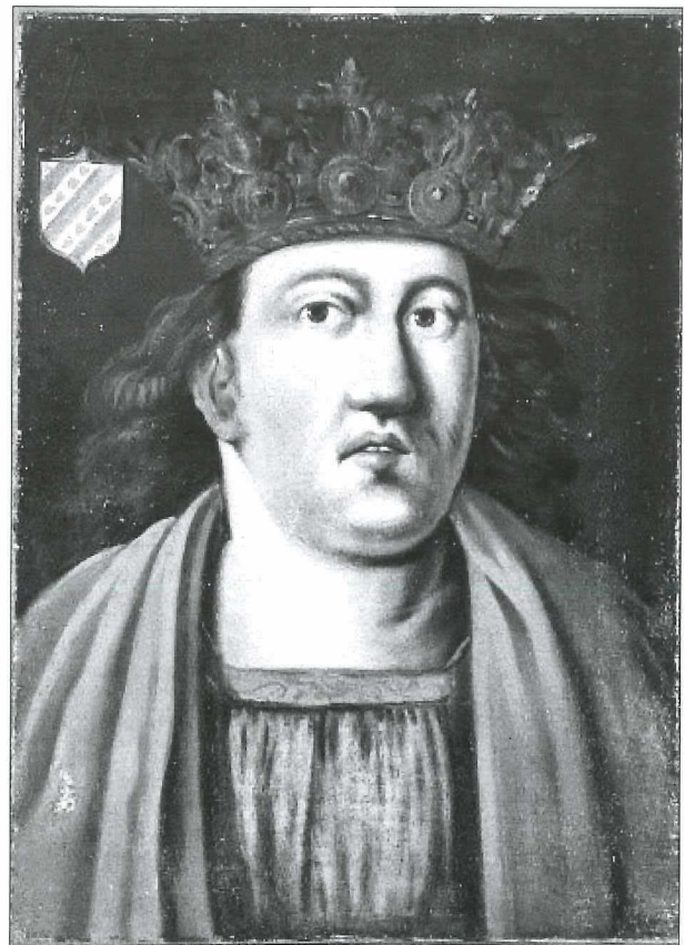
Afb. 3: Het Radboudportret van de familie Van Sminia.