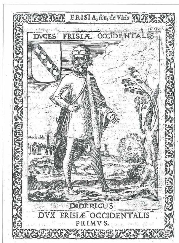
Afb. 1: Diederik, eerste hertog der Friezen. Met op de achtergrond de stad Medemblik. Vervaardigd door Pieter Feddes van Harlingen (1618-1620).

De vierde (en tevens laatste) druk van de stadskroniek (1767) werd voorzien van drie prenten waarvan één de voorgenomen doop van koning Radboud afbeeldt. 4