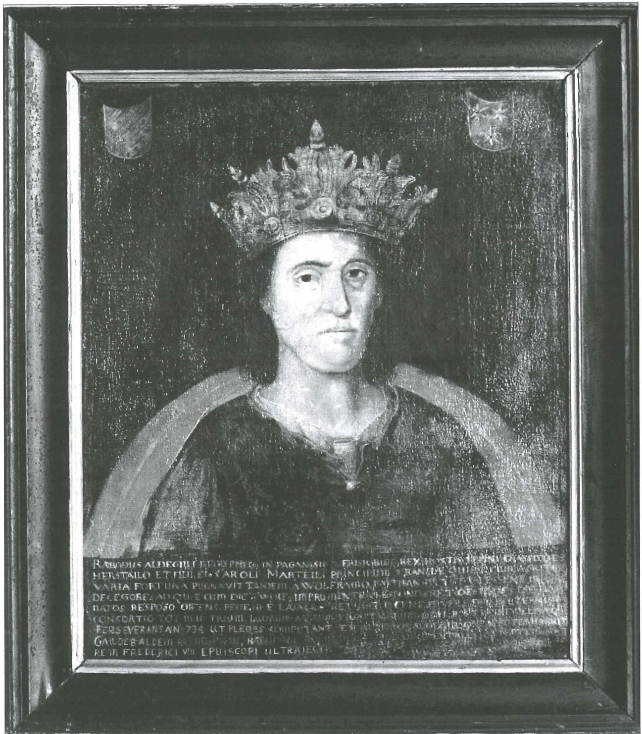
Afb.2: Het portret van Koning Radboud op het voormalige stadhuis in Medemblick.

De stedentrots kwam ook tot uiting in de naamgeving van een oorlogsschip. Ten tijde van de Eerste Engelse Oorlog (1652-1654) maakte de 'Koning Radboud' deel uit van de Nederlandse militaire vloot. Dit schip was uitgerust door de zogeheten Directie van Medemblick, een organisatie die was opgericht om de handelsvaart op de Noord- en Oostzee te beschermen. De 'Koning Radboud' was in 1653 te Amsterdam gekocht en alle uitgaven voor de aankoop en uitrusting kwamen ten laste van de stadskas. 8