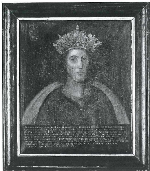
Afb. 4: De kopie van het oorspronkelijke Medemblicker portret, geschilderd door Chris Manshande.

Meer plausibel is dat Petten verantwoordelijk was voor het goudschilderen van de lijst.