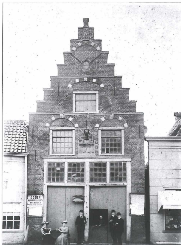
Afb. 1: Het Waaggebouw in 1890.

Het Waaggebouw in het centrum van de stad (Kaasmarkt 2) wordt al tijdens de oprichting gekozen voor de inrichting van een Oudheidkamer. De gemeente heeft daarvoor een schenking van f 1500,- gegeven. Bovendien krijgt de vereniging een renteloze lening van f 750,- (terug te betalen in vijf jaar).