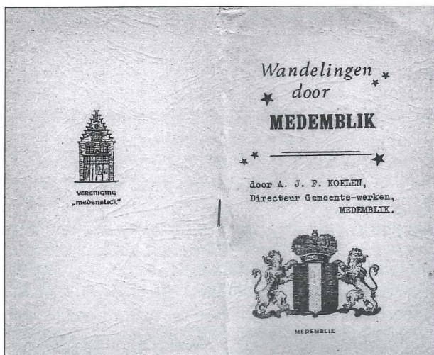
Afb.4: Omslag van het boekje Wandelingen door Medemblik (1964).