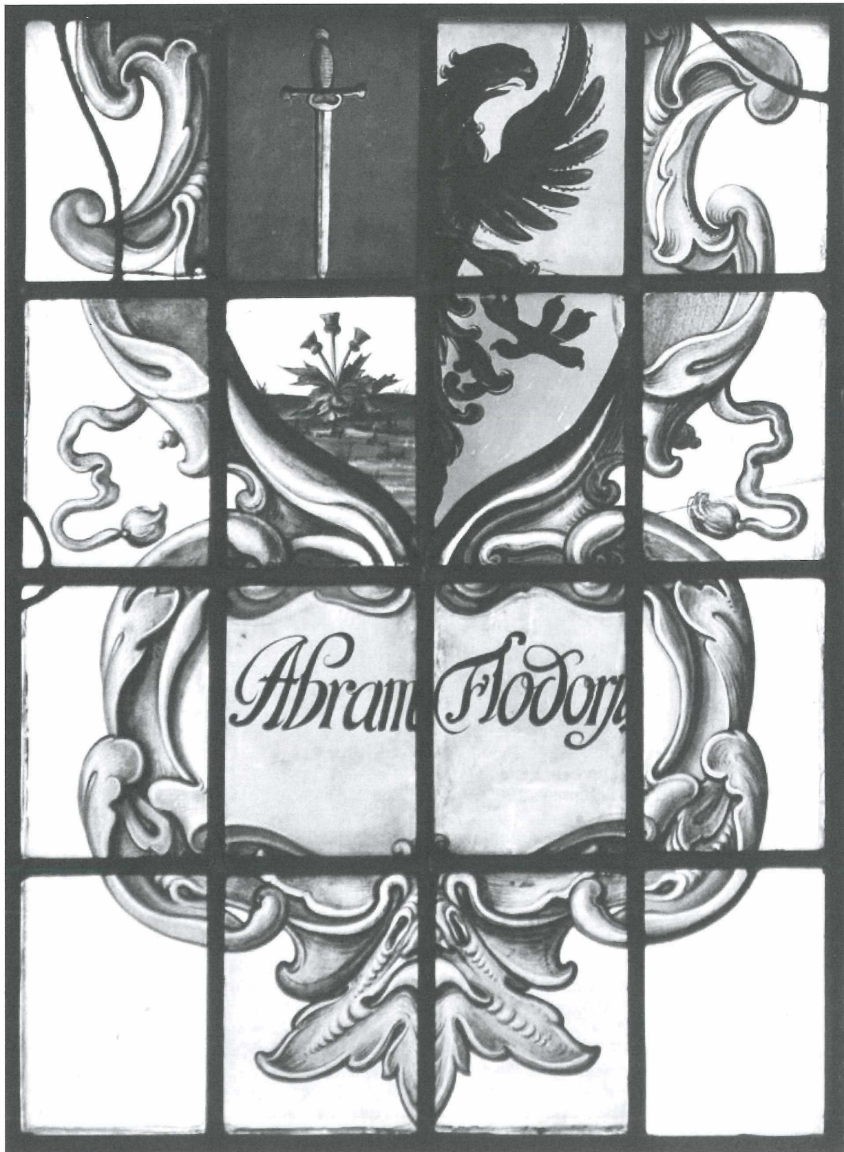
Afb.4: Het wapen van Abram Jansz Flodorp, broer van VOC-schipper Jan Jansz Flodorp. Abram Jansz was majoor van de schutterij en diaken van de gereformeerde kerk in Medemblik. Detail van een gebrandschilderd glas in de Bonifaciuskerk te Medemblik.