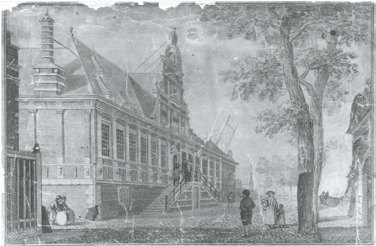
Afb.2: Het Oostindisch huis aan de Wierdijk in Enkhuizen. Hier zetelde het bestuur van de VOC-kamer Enkhuizen. Op de achtergrond is de spiegel van een VOC-schip in aanbouw te zien. De tekening is gemaakt door A. Andriessen omstreeks 1775.

In 1650 keerde hij uit Brazilië terug als commies in dienst van de West-Indische Compagnie.