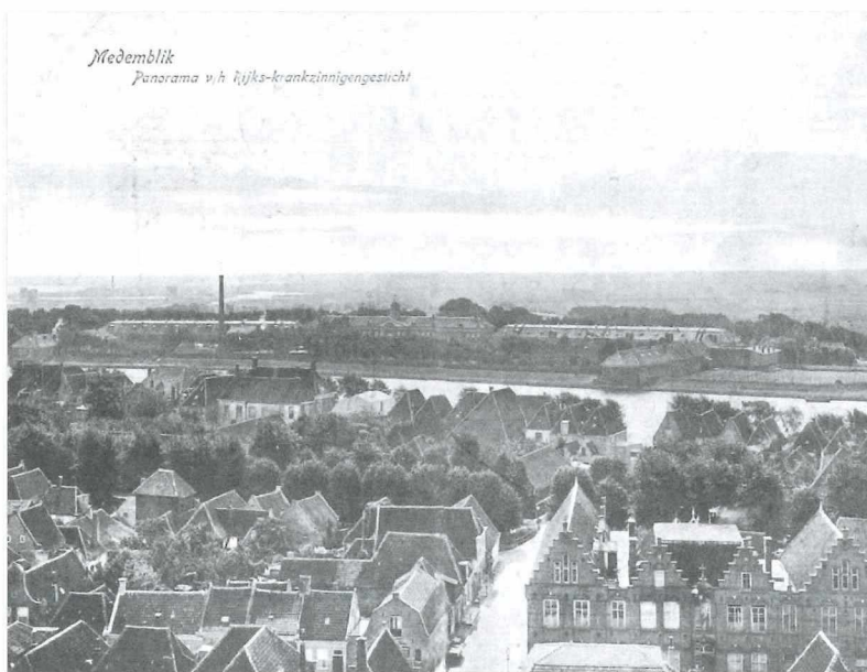
Afb.3: Panorama van het Rijkskrankzinnigengesticht uit circa 1908.