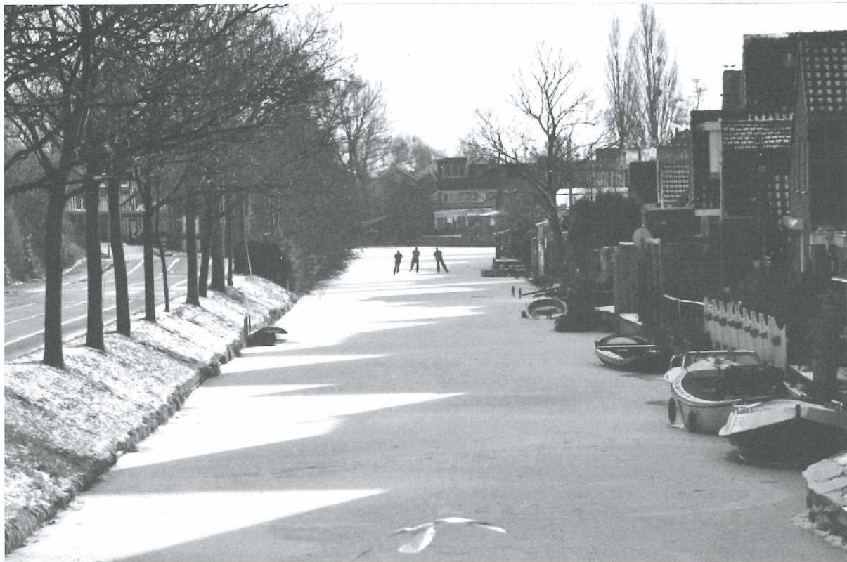
Afb. 15: Een recente foto uit 2011.

Rechts op de voorgrond is de kruidenierswinkel van de familie Bende met een nijdig schoorsteentje op het dak. Kruideniers waren er in die tijd genoeg, mede door de komst van arbeiders van elders voor de aanleg van de Wieringermeerpolder.