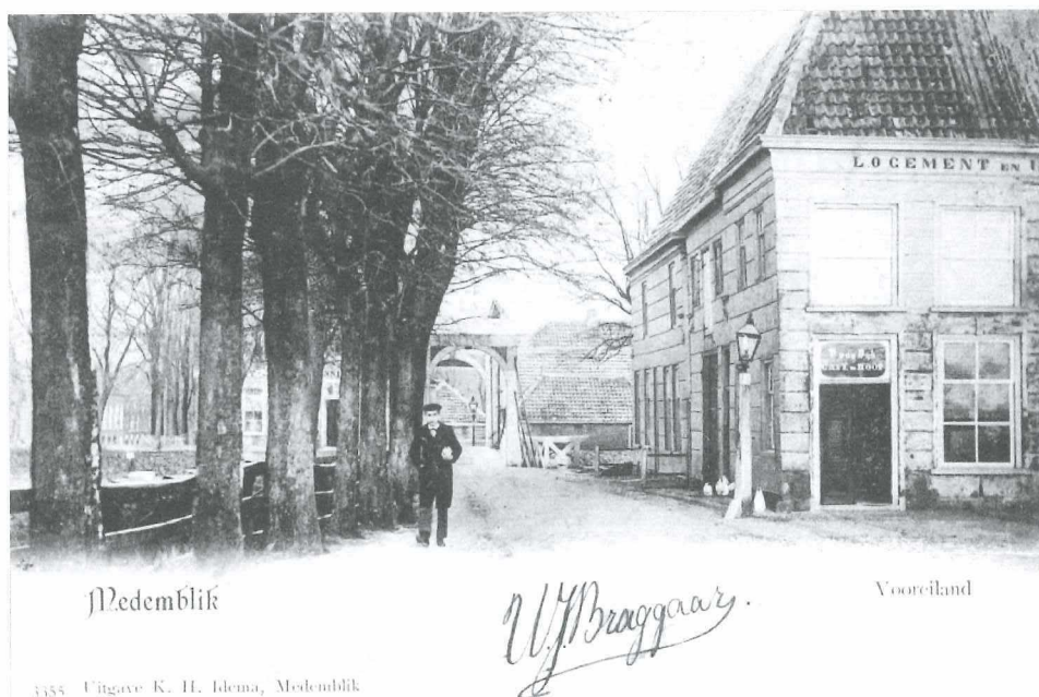
Afb.5: Hoek Hoogesteeg - Vooreiland in het begin van de 20 e eeuw.

Ook op deze oude ansicht (Afb.5) staan de bekende iepen langs de straat. Rechts op de hoek staat een hardstenen lantaarnpaal met olielamp.