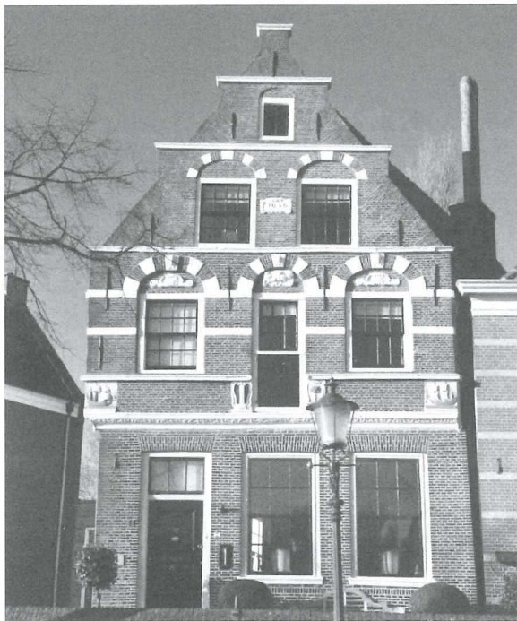
Afb.8: Oosterhaven 44 anno 2011.

Gelukkig bleef dit lot het pand Oosterhaven 44 bespaard. We zien nu een prachtige dubbele schoudergevel (Afb.8). Het is een sieraad voor de stad.