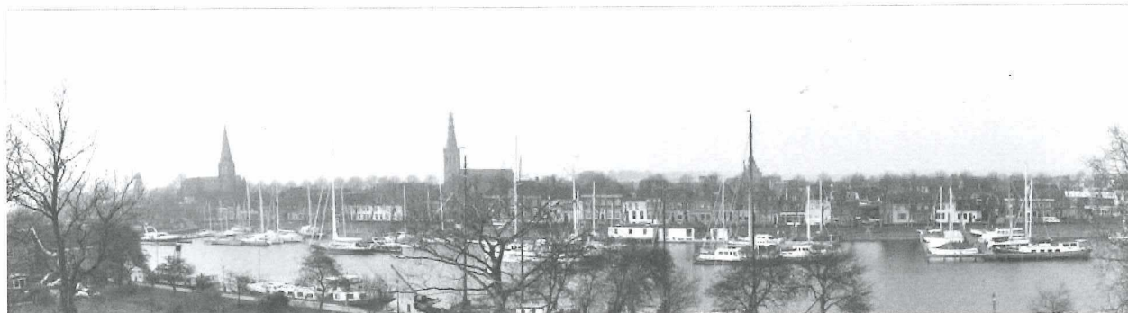
Afb.2: De Westerhaven in 2011 (met dank aan mevrouw Thepe).

Langs de straat staan nog jonge iepen die in de oorlog gesneuveld zijn. Helemaal tegen de Turfhoek aan zien we nog twee kappen van stadsboerderijen.