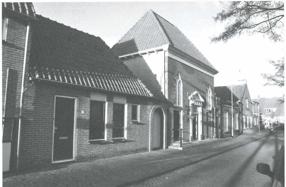
Afb.10: Het Gedempt Achterom in 2011.

Op de foto uit 2011 (Afb.10) zien we dat de synagoge in volle glorie is hersteld. Daarnaast staan keurige nieuwe woonhuisjes. Het gevolg van meer welvaart en cultuurhistorisch besef.