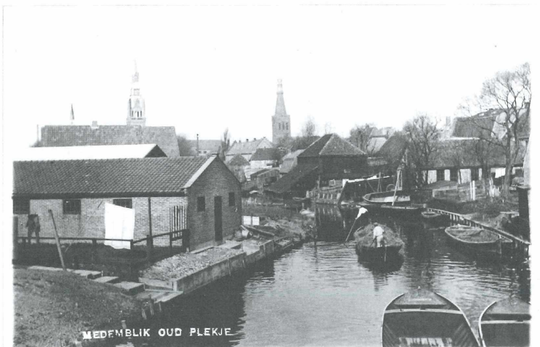
Afb.11: Gracht achter de Turfhoek omstreeks 1930.

De gracht achter de Turfhoek is gegraven bij de uitbreiding van de stad met de Westerhaven in 1632.