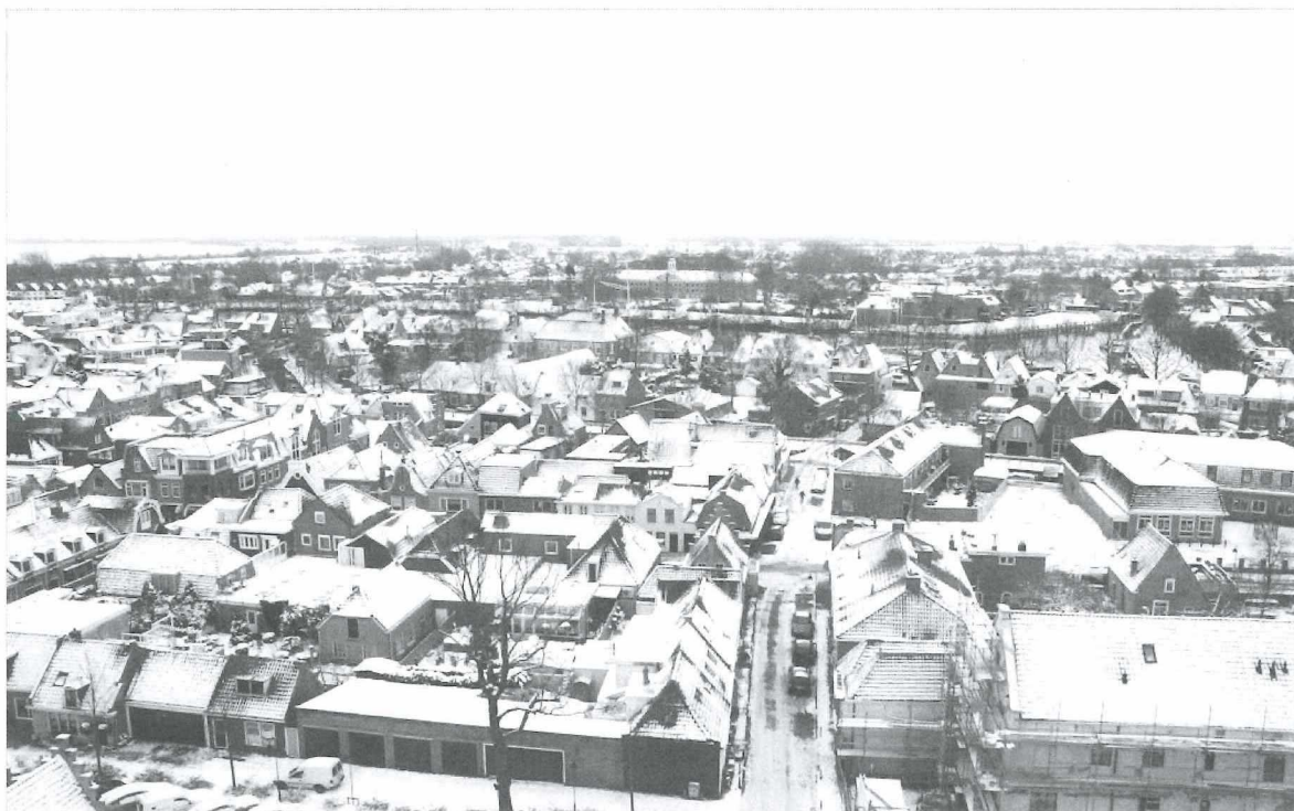
Afb.4: Foto vanaf de toren van de Bonifaciuskerk uit 2010.

Links in de verte een paar watermolenstompen, de pijp van het stoomgemaal en het water van de Kleine Vliet.