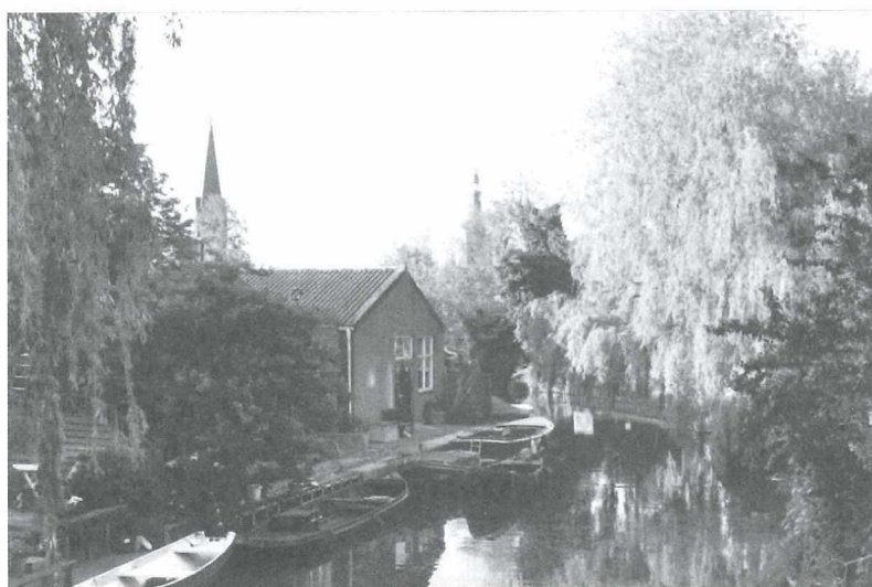
Afb.12: De gracht achter de Turfhoek op 26 juli 2011.

Via de gracht achter de Turfhoek brachten tuinders uit onder andere Onderdijk en Wervershoof hun producten naar de doorvaar-afmijnlokalen van de veiling. Zij bereikten de gracht via de Brakesloot en het Overlekerkanaal. De oversteek van het kanaal was met harde noordwestenwind een hachelijke zaak.