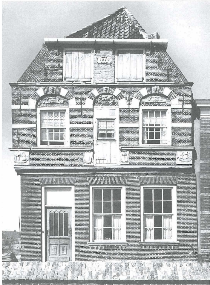
Afb.7: Het pand Oosterhaven 44 in 1950.

Met veel mooie panden in de stad is het slecht afgelopen; te duur voor onderhoud waarna sloop restte.