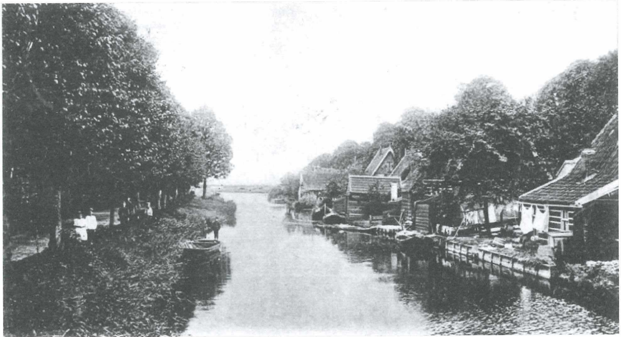
Afb. 13: De Vlietstroom omstreeks 1900.

Rechts op de oude foto (Afb.13) zien we wat boerenbedoeninkjes en links de Oostersingel. Aan dit stukje Oostersingel tot aan de bocht stonden drie boerderijen. Precies op de bocht stond een half houten huis, laatst bewoond door een familie Wijdenes. Dat huis was in de eerste helft van de 19 e eeuw kantine voor de adelborsten die in die tijd het Westereiland bevolkten.