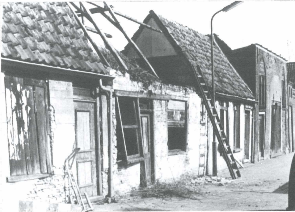
Afb.9: Het Gedempt Achterom in 1960.