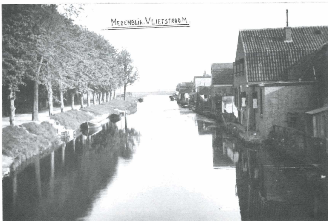
Afb. 14: De Vlietstroom omstreeks 1930.

In de sloot liggen veel schuiten voor het vervoer van hooi en andere goederen ten behoeve van de veehouderij aan het Geldeloze pad. Aan het einde van "het Pad" was een brugje (hier niet te zien) naar het Vierkantje dat naar de Brakeweg leidde. Voor veel oud-Medenblikkers onderdeel van de zondagse wandeling.