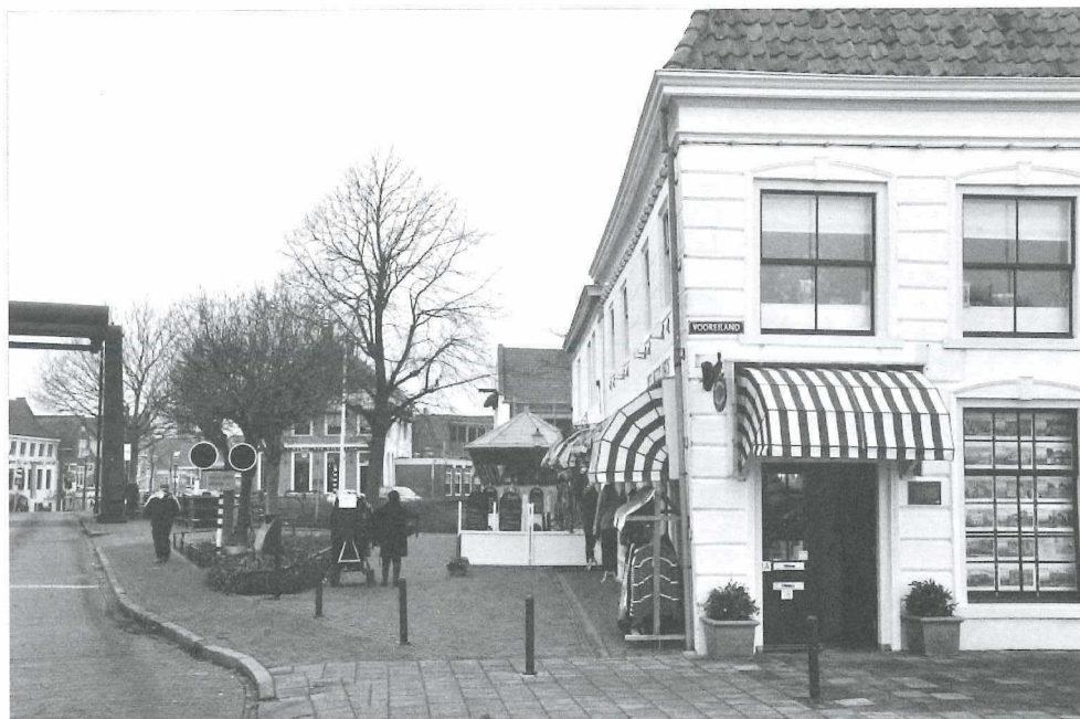
Afb.6: Hoek Hoogesteeg - Vooreiland anno 2011.

de oude Kwikkelsbrug, een dubbele wipbrug die aan twee kanten bediend moest worden. Aan de overkant van de brug staat een laag gebouwtje; dat was het huisje van de Oosterbrandspuit.