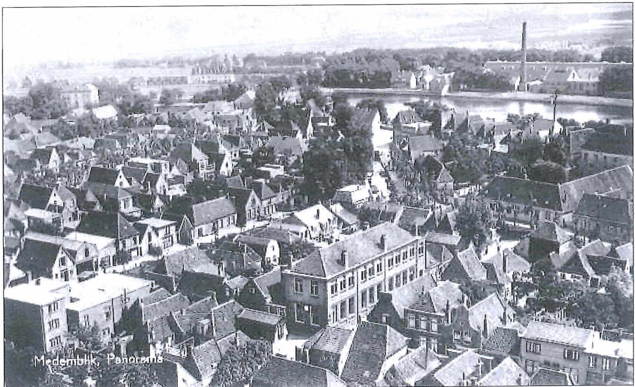
Afb. 3: Panorama van Medemblik omstreeks 1930 met onder in het midden de school aan het Bagijnhof. De school werd in 1878 als openbare school geopend. In 1921 werd er een verdieping opgezet waarna tijdelijk het openbaar en bijzonder onderwijs onder één dak waren verenigd: beneden de School met den Bijbel en boven de openbare school.

Ondanks de lacunes in de bronnen is het niet ondenkbaar dat er rond deze periode reeds vormen van christelijk onderwijs bestonden, zij het nog niet in een apart schoolgebouw en hoogstens op kleine schaal. 17