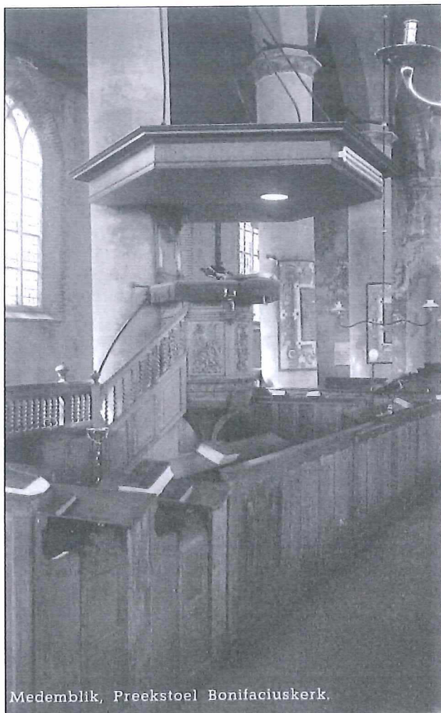
Medemblik, Preekstoel Bonifaciuskerk.

Alle informatie wijst er daarom op dat de 22 als hervormd geregistreerde Medemblikkers die het petitionnement hebben gesteund hiertoe niet zijn aangespoord door de voorman(nen) van hun geloofsgemeenschap.