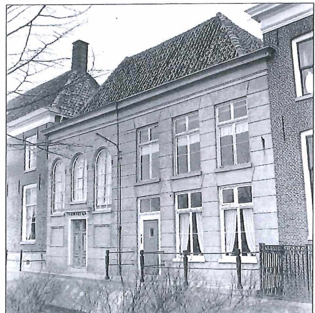
Afb.2: De lutherse kerk aan de Westerhaven.

Goed en wel beschouwd bevonden zowel de hervormden, christelijk-gereformeerden als hersteld-lutheranen zich in de jaren naar de aanloop van het volkspetitionnement in fases van (weder)opbouw en heroriëntatie. Bij de doopsgezinde gemeente stonden de zaken er beter voor: diverse leden van de (rijke) families zaten in het stadsbestuur en andere maatschappelijke organisaties.