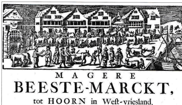
Afb. 1: De ossenmarkt op het Breed in Hoorn, zoals afgebeeld op een keur uit 1761.

De vroege centrumfunctie van Hoorn rondom de handel in vee wordt in 1389 nog verder uitgebouwd. De Denen verkrijgen van Albrecht, graaf van Holland, via een handvest het recht om in Hoorn hun paarden en ossen op de markt te brengen. 6 Uiteraard eist de graaf een tegenprestatie; er dient tol of impost betaald te worden voor ieder dier dat wordt aangevoerd. 7 Deze tol/belasting werd aangeduid als 'beestentol'. Overigens werden er niet alleen ossen en paarden geïmporteerd, ook varkens werden vanuit Denemarken in West-Friesland aangevoerd. Soms probeerde men het vee illegaal aan land te brengen om zo de 'beestentol' te ontduiken. In 1343 werd een inwoner van Bovenkarspel om deze reden beboet. 8