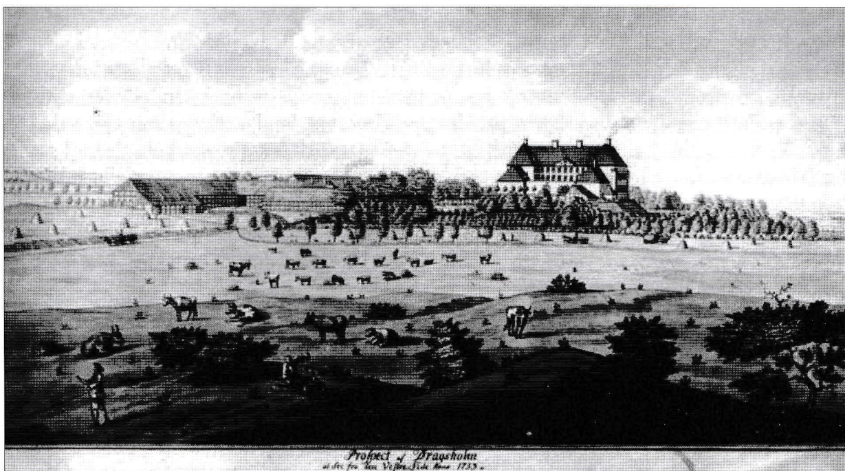
Afb. 2: Het Deense Slot Dragsholm, waar in de 17 e eeuw op grote schaal ossen werden gehouden.

Overigens, waren de omstandigheden voor een bloeiende Westfriese agrarische sector in de 14 e eeuw verre van ideaal. Vanwege deze omstandigheden is de periode tussen 1300 en 1400 in de literatuur ook wel aangeduid als de 'Waanzinnige 14 e eeuw'. 18 Gedoeld wordt dan op diverse uitbraken van de builenpest die een pandemische omvang had. 19 In de Lage Landen kreeg men behalve met de 'Zwarte Dood' ook te maken met politieke conflicten en daaruit voortvloeiende krijgshandelingen. 20