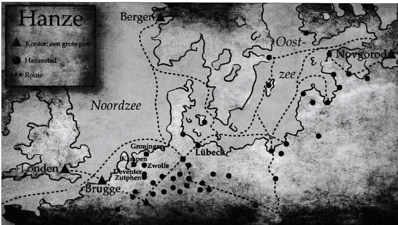
Afb.3: Een overzichtskaart met daarop enkele van de ca. 200 Hanzesteden alsmede enkele land- en zeeroutes.

Hamburg vormde een belangrijk zwaartepunt. Een mooi voorbeeld vormt de import van Hamburgs bier zoals we hieronder zullen toelichten. Maar iets minder bekend is de importrelatie met Engeland waar steenkool en wol werd ingescheept voor transport naar de Lage Landen. Ook Medemblikker schippers blijken in de middeleeuwen al actief te zijn in het kolentransport over de Noordzee, zo blijkt uit Engelse tolregisters. 27 Daarnaast maakten Medemblikker schippers in de periode 1597-1718 ook zeer regelmatig reizen naar het aan het Witte Zee gelegen Russische Archangel. 28