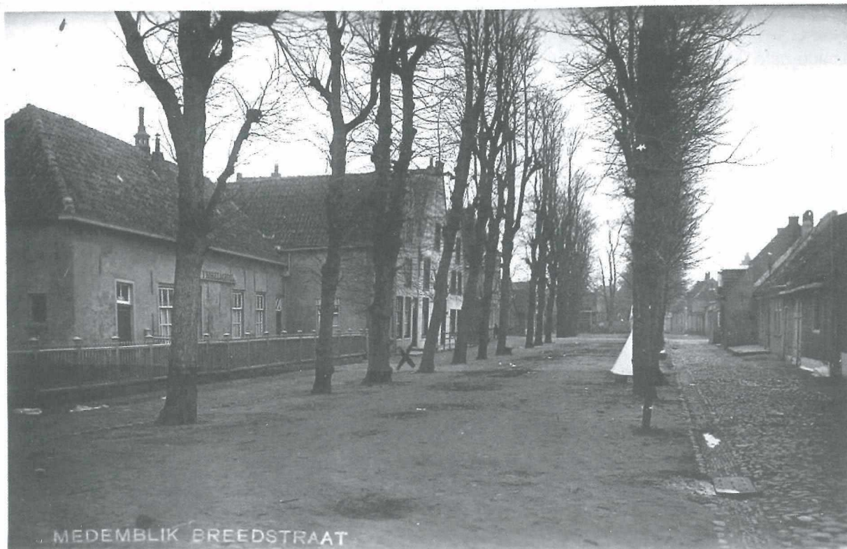
Afb. 1: De Breedstraat omstreeks 1930.