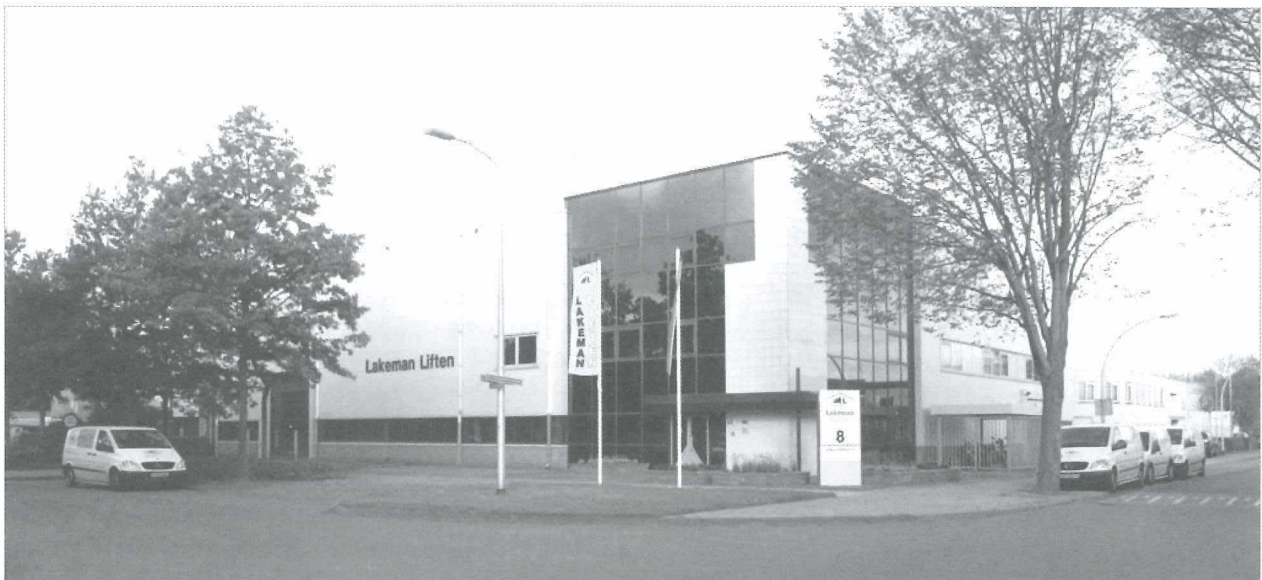
Afb.6: Bedrijfspannd van Lakeman Liften in Katwijk anno 2012.