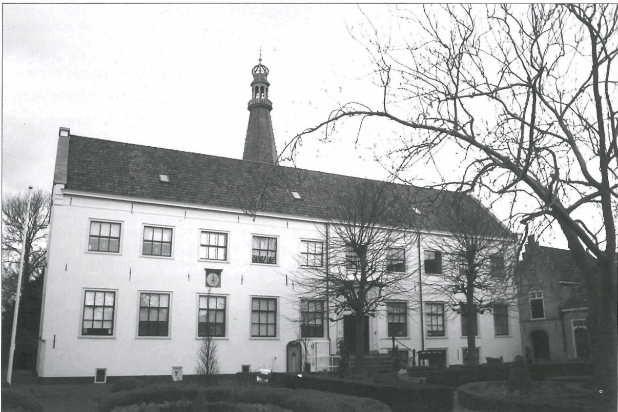
Afb. 4: Het weeshuisgebouw in 2011, oorspronkelijk huisvestte het kortstondig het Mariaconvent.

De stichting van een religieuze gemeenschap lag zeker niet altijd bij de Kerk zelf. Zo kon het initiatief bijvoorbeeld ook liggen bij een vermogende weduwe met een idealistisch bekeringsideaal of een rijke stadsmagistraat die wilde getuigen van zijn voorname geestelijke gezindheid. 28 In het geval van Medemblik zijn geen gegevens bekend met welke motivatie of door wie de conventen zijn gesticht. Maar het ontstaan van het eerste (en wellicht ook tweede) convent in Medemblik is ongetwijfeld aangejaagd door Paulus Albertsz.