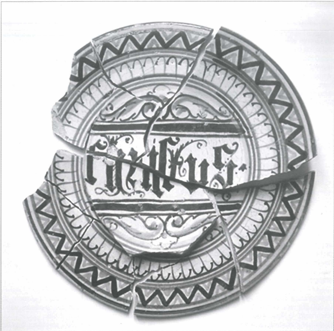
Afb.5: Majolica schotel met de tekst 'Christus'. Gevonden tijdens opgravingswerkzaamheden in het Begijnhof in juni 2014.