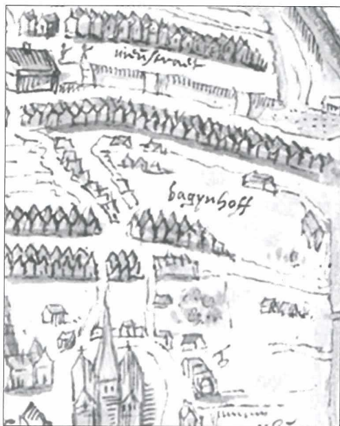
Afb.3: Detail van het Bagijnhof achter de Nieuwstraat.