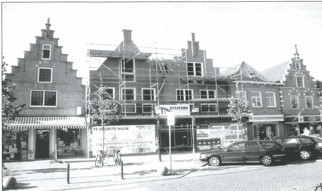
De nieuwe panden, een verrijking voor de Nieuwstraat, oktober 2003.

De firma L.P.W. van der Zee was één van hen. Potten en pannen, radio's voor negentig gulden per stuk, Mutsaerts kinderwagens, Jaarsma haarden voor f 180,- per stuk, stofzuigers en lampen van Philips. Het gehele assortiment werd tentoongesteld. Het was voor Medemblik en omgeving een week feest daar op het voormalige D.V.O terrein. Na twee dagen liepen de bezoekers door een prutmassa. De firma W. Heerdt loste dit probleem in één dag op door de gehele loopruimte te bekleden met tegels uit eigen fabriek.