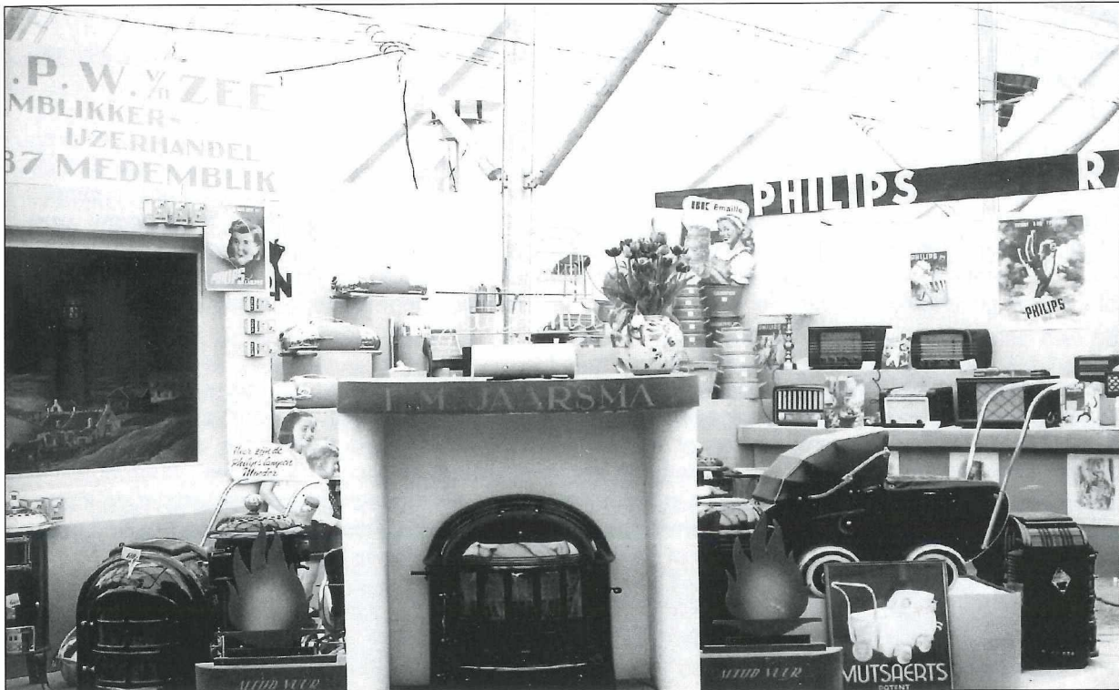
De stand van de firma L.P.W. van der Zee op de "Memito" van 1949.

De jaren na de oorlog en de jaren vijftig verliepen crescendo in de zaak aan de Nieuwstraat. Het butagas werd massaal in gebruik genomen. Nieuwe artikelen verschenen op de markt. Beurzen werden opnieuw bezocht. In Medemblick werd in 1949 door de plaatselijke middenstand de 'Memito' georganiseerd. In een grote tent op het voorste gedeelte van het sportveld aan het Vooreiland werden stands ingericht van de plaatselijke middenstanders.