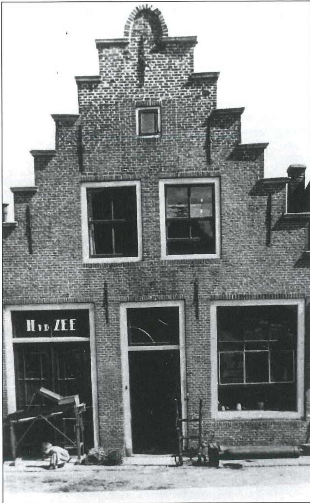
De voormalige smederij, Nieuwstraat 65.