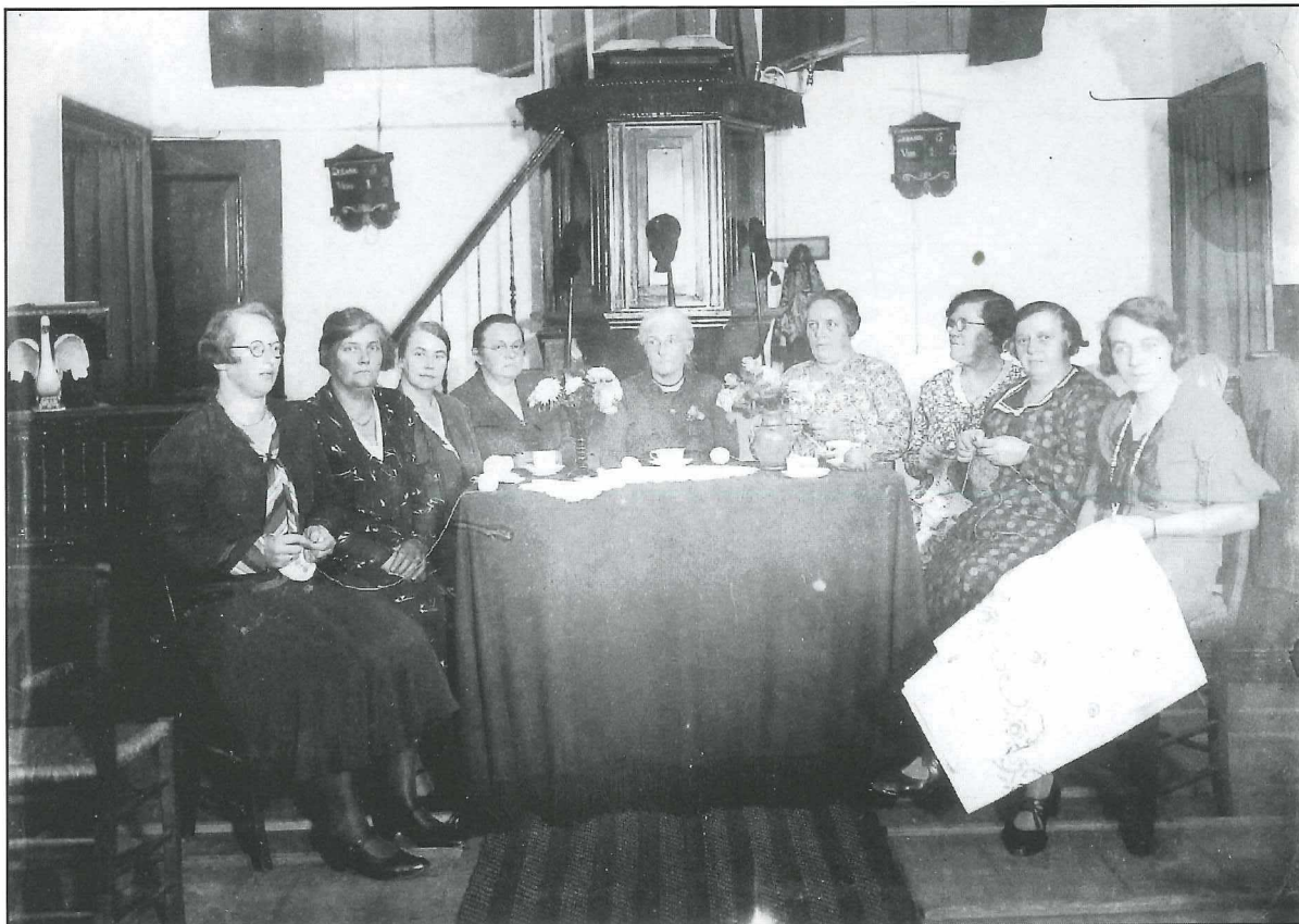
De dameskrans van de Lutherse kerk rond 1932.