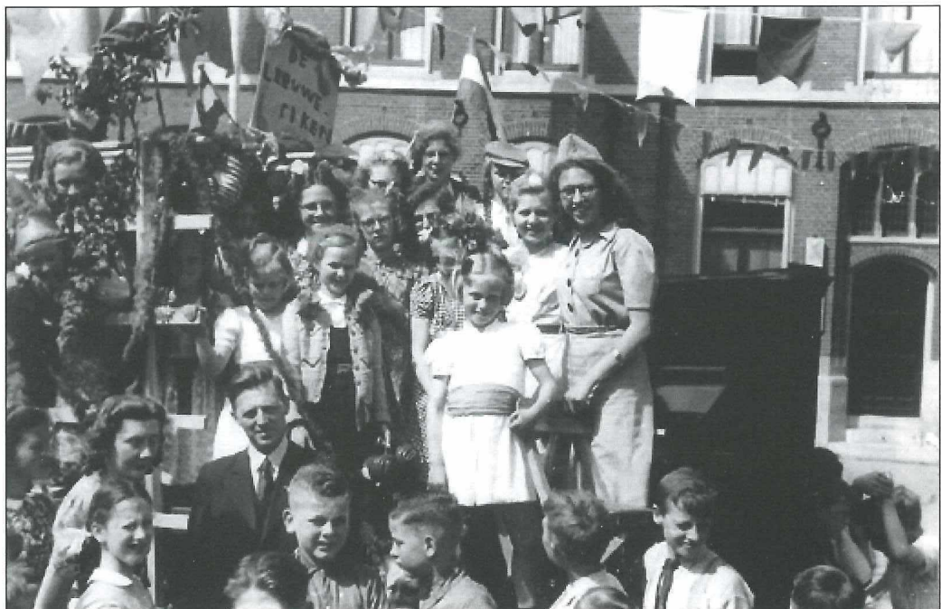
Bevrijdingsfeest in Medemblik. Hier de praalwagen van de "Leeuweriken" voor het postkantoor.

Honderden mensen lopen door hongersnood in lange rijen in de hevige kou langs de wegen in West-Friesland en Wieringermeer. Een handwagen, fiets met antiplofbanden of slede met zich mee zeulende.