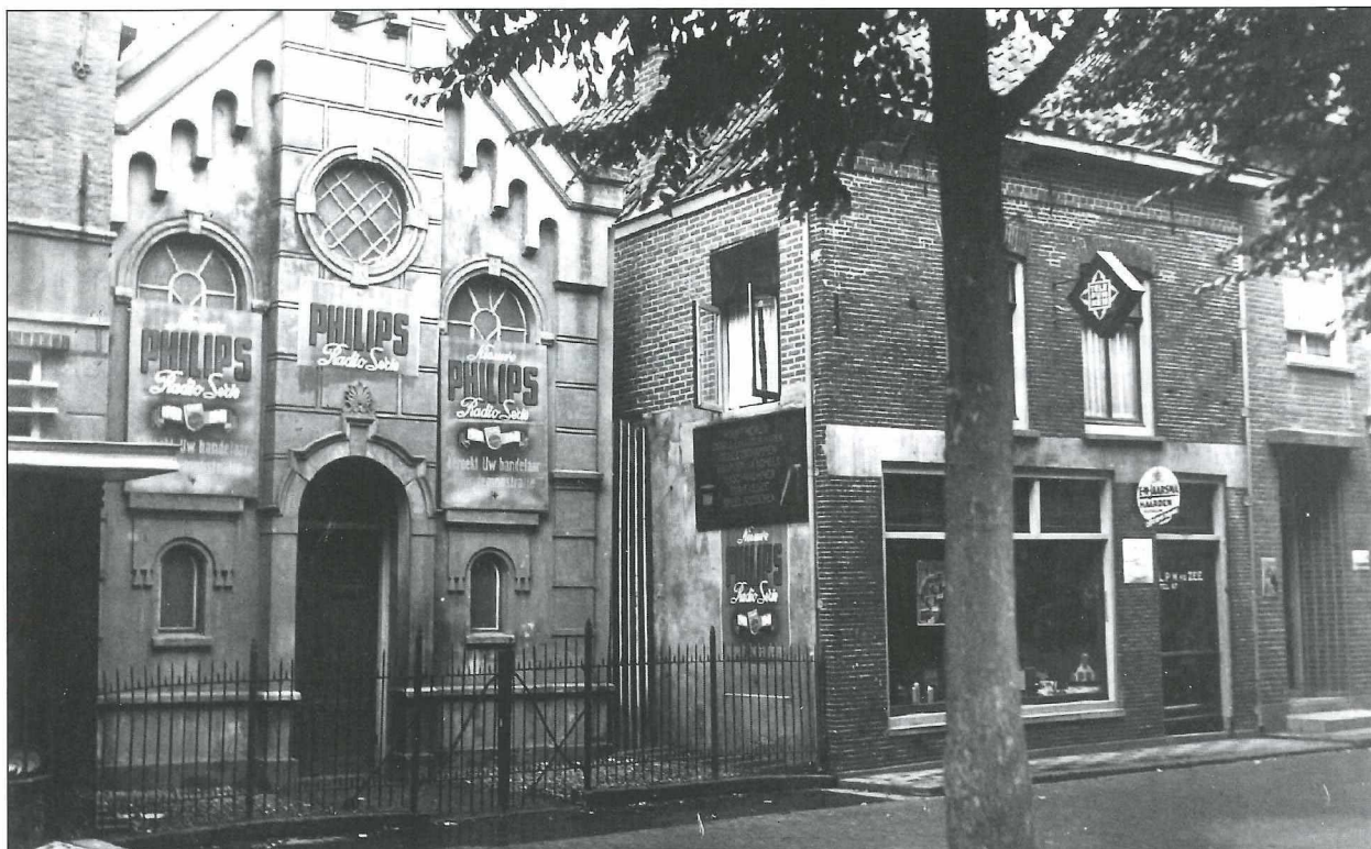
Het winkelpand van de fa. Van der Zee, Nieuwstraat 44 met links de voormalige Gereformeerde Kerk rond 1939. Met Koninginnedag stond voor de kerk de muziektent.

De Gereformeerde gemeente verhuisde, na 56 jaar gezeteld te hebben op de Nieuwstraat - 1883/1939 - naar de Meerlaan, waar zij een veel grotere kerk hadden laten bouwen. Kort erop kwamen de slimme reclamemakers van Philips en plaatsten grote emaille bordes aan de voormalige kerk met de boodschap, dat de nieuwe Radio-serie op de markt was gekomen ... raadpleeg uw handelaar. Kort erop brak de mobilisatie uit en werd de voormalige kerk ingericht voor de Nederlandse soldaten.