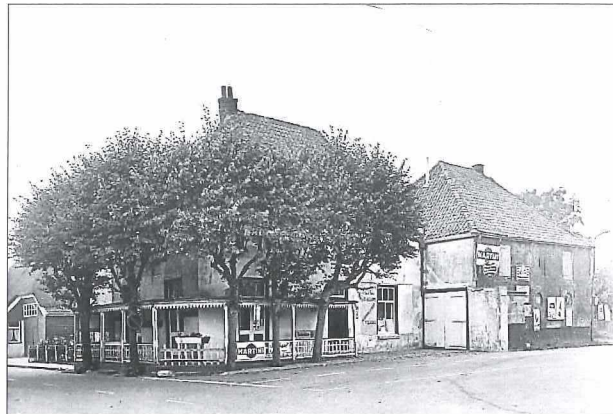
Afb. 2a: Het Medemblikker Tolhuis in 1969, vier jaar voor de brand.

Vandaar de naam tolhek. Op de oudst bekende afbeelding uit 1740 is het hele ensemble van Tolhuis en uitspanning, paardenstal en tolhek te zien (zie afbeelding 2). Kijken we 229 jaar later naar het gebouw (zie afbeelding 2a), dan herkennen we in het exterieur nog overduidelijk het oorspronkelijke gebouw.