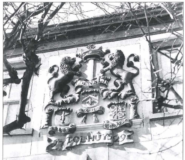
Afb.4: De forse gevelsteen op de zuidgevel van het Medemblicker Tolhuis (1949).

Op een foto uit 1949 (afbeelding 4) wordt het beeld van het schilderij beter zichtbaar gemaakt en zien we, in vergelijking met de beide kozijnen, de forse omvang van deze uit twee delen bestaande gevelsteen. De omvang van de steen kan eigenlijk niet anders bedoeld zijn dan om iedere passant te imponeren en tegelijkertijd duidelijk te maken dat dit gebouw een vooruitgeschoven post betrof van de stad Medemblik.