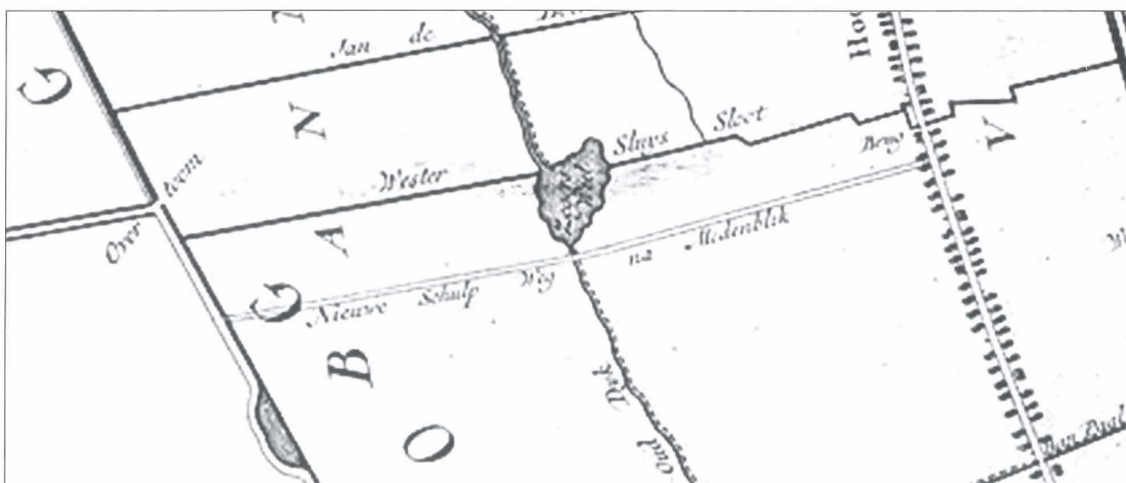
Afb. 1: De Nieuwe Schulp Weg na Medemblik op een kaart van Govert Oostwoud uit 1743.

De verwervingskosten waren in het verzoekschrift als hoog ingeschat en bleken in de praktijk ook zo uit te pakken. Wellicht was van enige prijsopdriving sprake omdat Medemblik niet de beschikking had over een onteigeningstitel. In totaal heeft Medemblik 1.785 roede 2 grond verworven voor een totaalprijs van f 1520,- 3 .