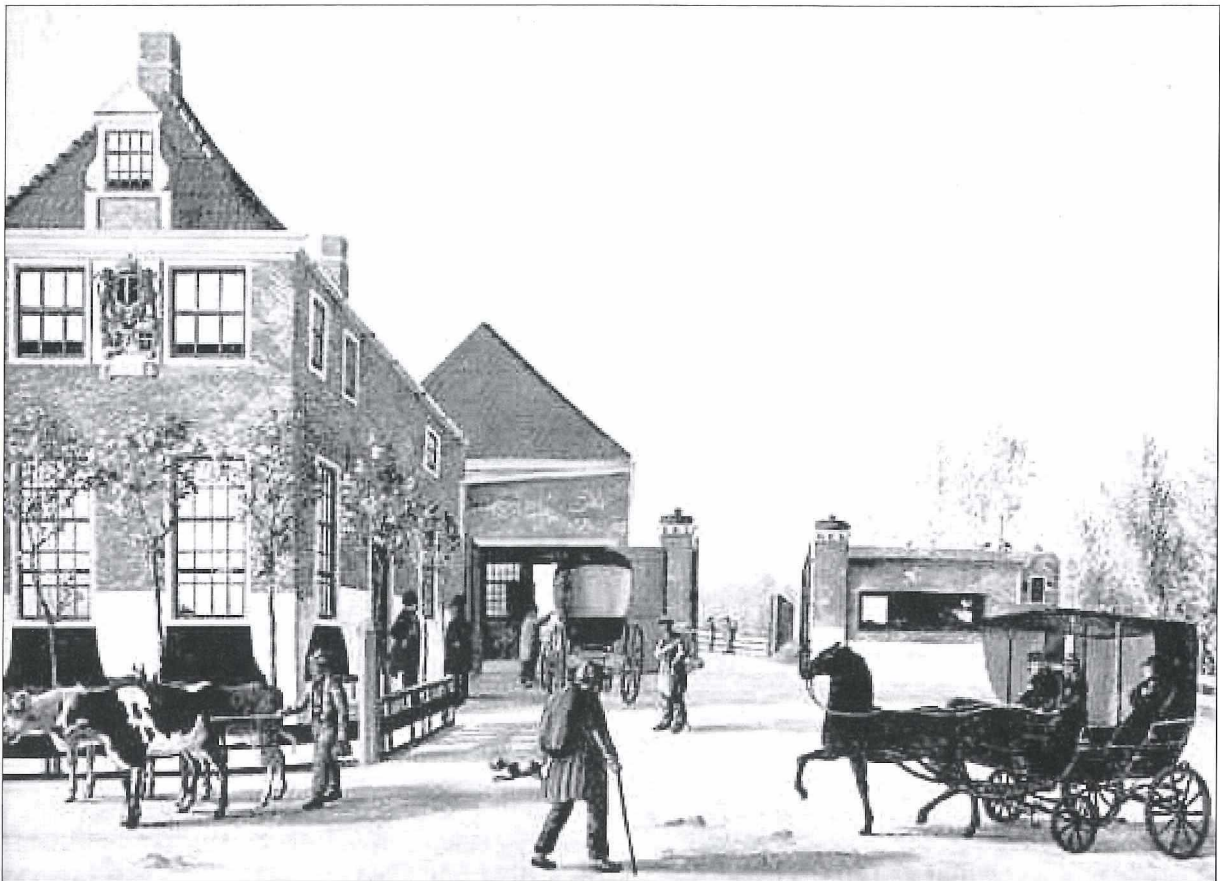
Afb.3: Het in 1729 nieuw gebouwde Tolhuis incl. gevelsteen op een schilderij van A.F. Kok uit 1843.

Behalve de compositie van de gebouwde omgeving, geeft de schilder ook mooi weer voor welke passages de Tolweg werd gebruikt: individuele wandelaars, agrarisch gebruiksverkeer en personenvervoer met behulp van getrokken rytuigen.