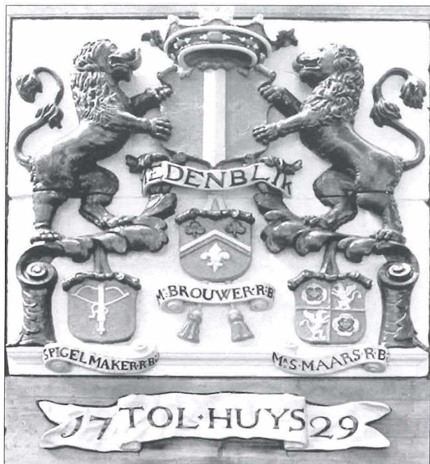
Afb. 5: De originele gevelsteen zoals destijds was ingemetseld in het nieuwe Tolhuis in 1729 en na de restauratie is aangebracht op de gevel van het Zuiderzeemuseum.