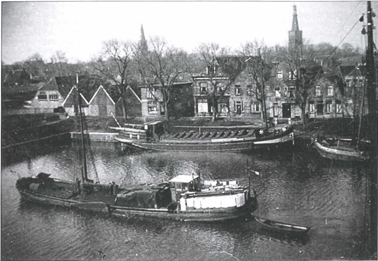
Afb. 4: Aardappelschip(?) in de Oosterhaven (1943-1945).

Er waren twee soorten menu's: standaard alles bij elkaar en een luxe menu met een toetje. Omdat we aardappels hadden ingeleverd kregen we het luxe menu met een toetje. Dat was vaak een soort vla. Als ik nu blanke vla eet, kan ik me de smaak van dat toetje nog steeds herinneren.