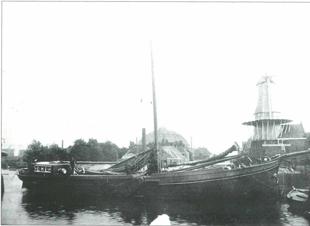
Afb.3: De klipperaak 'Actief' afgemeerd bij de molen 'de Adriaan' in Haarlem (1910).