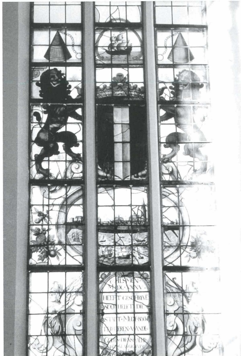
Een afbeelding van het Medemblicker raam in de kerk van Schermerhorn. Behalve het wapen van de stad is door Maerten Busier ook een aanzicht van Medemblik op het glas geschilderd. Hij kreeg in 1636 voor deze opdracht ruim 117 gulden.

Al in de zestiende eeuw bezat de Bonifaciuskerk gebrandschilderde ramen. Zowel na de verwoesting van de kerk in 1517 als na de stadsbrand van 1555 ontving de kerk van diverse schenkers een glas. In het midden van de zeventiende eeuw was de toestand van de kerkramen zorgelijk. Op 24 januari 1654 werd in de vergadering van de stadsbestuurders gemeld dat de glazen indese kercke seer zijn veroudt ende los staen en met perculo [gevaar] om tans ofmergen door storm en onweederymant daer door beseert te werden . 22