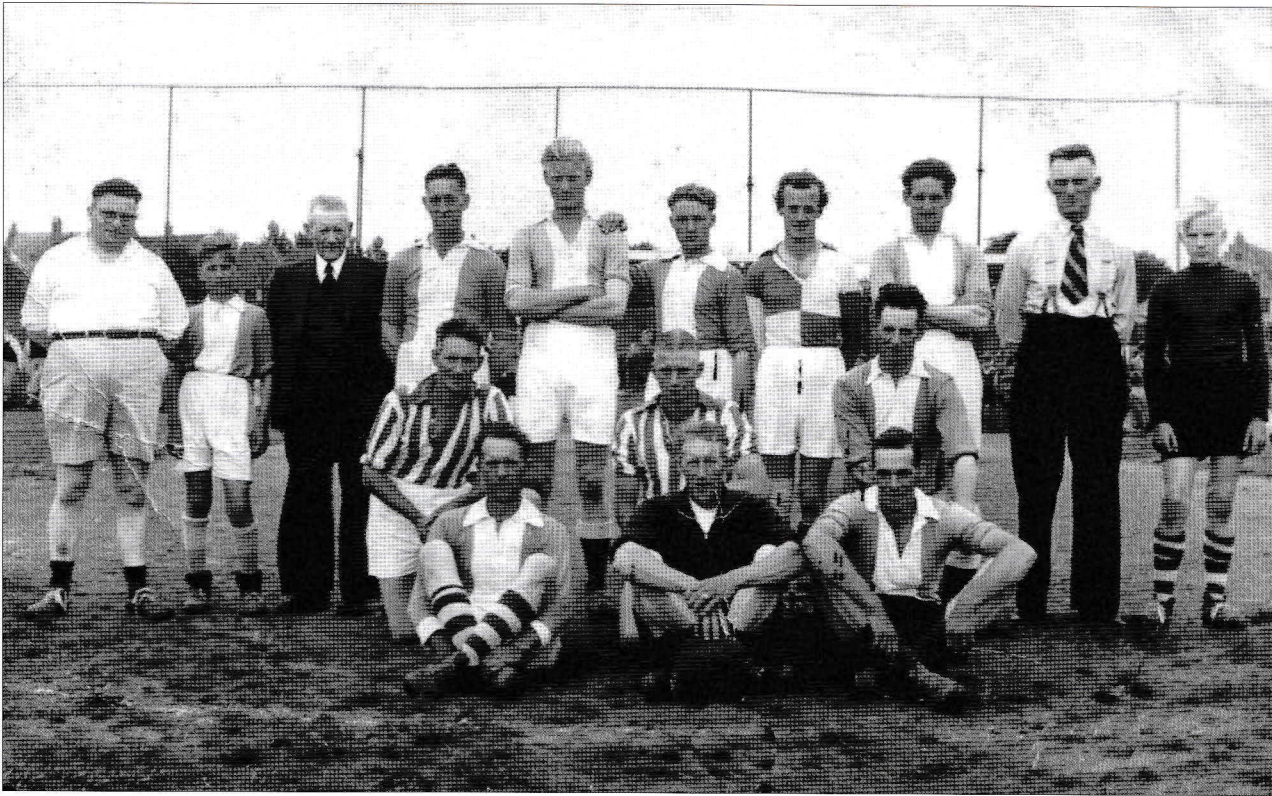
Afb. 5: Het Pronkenelftal (v.l.n.r.):