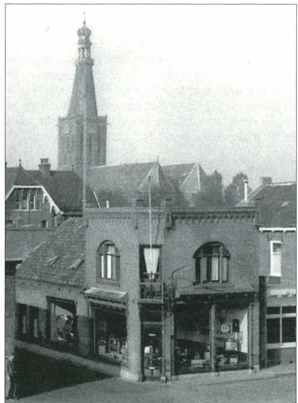
Afb.5: Radio Bood op de hoek Nieuwstraat-Bagijnhof (ca.1960).

Een leuke anekdote betreft de reparatie van de tv van de heer Beerepoot in het Bagijnhof. Beerepoot lag te slapen toen Rinus kwam. Na de reparatie, er moest een buis worden vervangen, sliep hij nog.