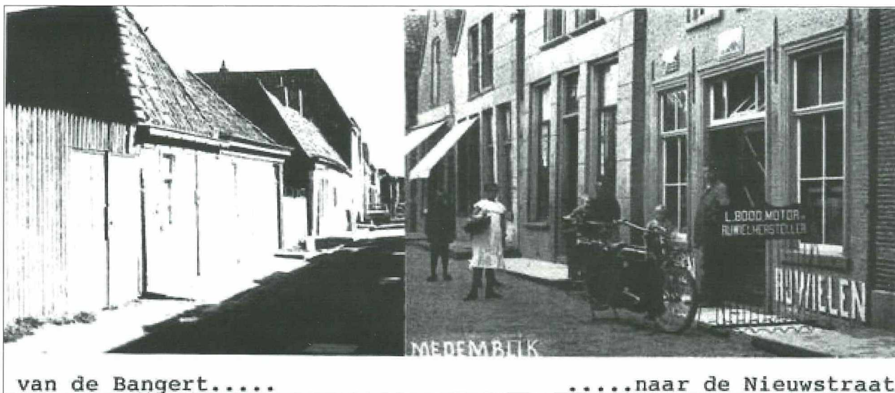
Afb.1: Van de Bangert naar de Nieuwstraat (ca. 1917).