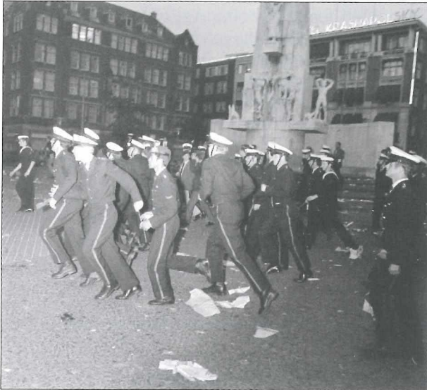
Afb.7: De mariniers vegen de Dam schoon.

Ondanks de massale sympathie voor deze actie worden alle betrokkenen krijgstuuchtelijk bestraft. Bram moet zorgen dat die maatregel bij zijn manschappen wordt uitgevoerd.