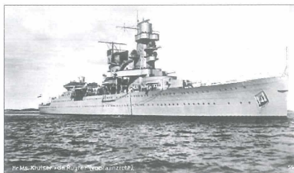
Afb.6: Hr.Ms. De Ruyter in betere tijden.