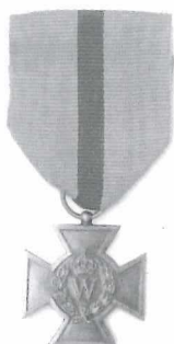
Afb.5: De Engelandvaarders ontvangen het Bronzen Kruis.