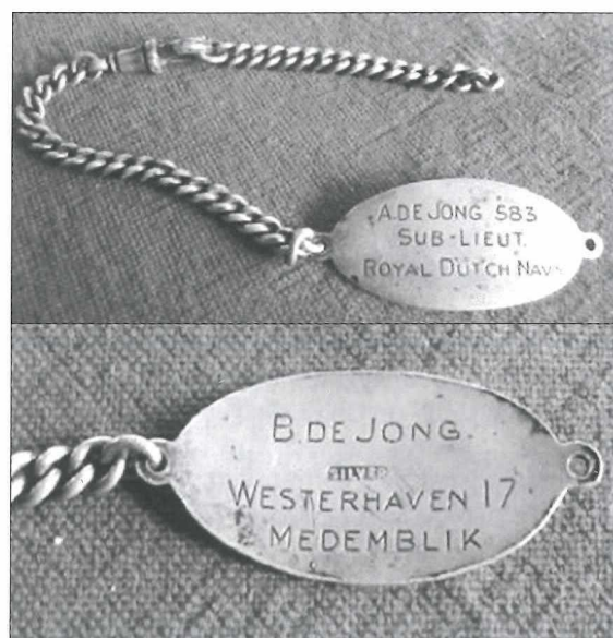
Afb. 1: Het verloren en weer opgevisste kettinkje.