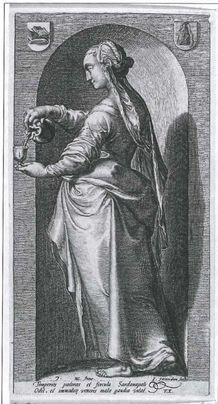
Afb.2/3: Een schenkende vrouw als personificatie van de matigheid. Boven de gevelsteen in het pand Vooreiland 12 en daaronder een prent uit 1593.