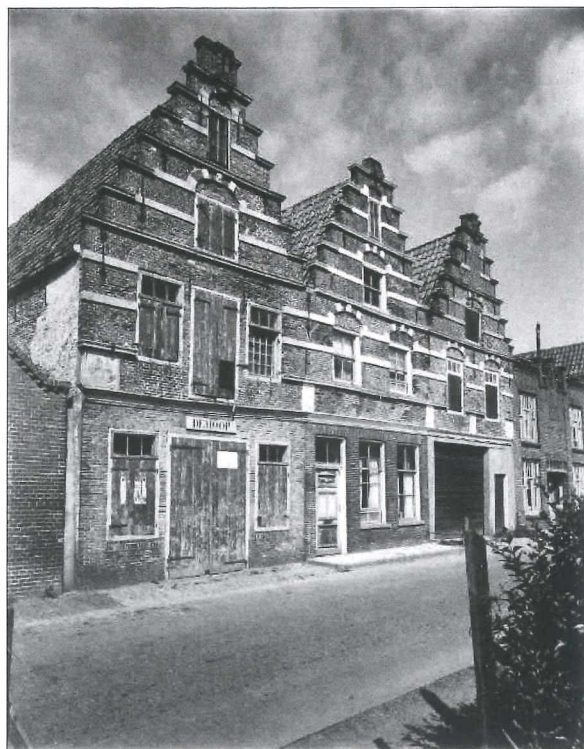
Afb. 1: De drie trapgevels aan het Vooreiland in 1950. Rechts van de drieling stond ook een zeventiende-eeuws pand met trapgevel. Dat werd in 1921 gesloopt om plaats te maken voor het dubbele woonhuis Vooreiland 13-14.

Maar wanneer zijn de drie huizen precies gebouwd en wie gaf hiertoe opdracht? De gevels zelf geven geen antwoord op deze vragen. Een gevelsteen of muurankers met het bouwjaar ontbreken. Wel zijn in de voorgevels andere gevelstenen ingemetseld: twee waarop een schip is afgebeeld en drie anderen die de deugden hoop, geloof en de matigheid weergeven. Dit zijn algemene voorstellingen die de identiteit van de zeventiende-eeuwse opdrachtgever niet direct prijsgeven.