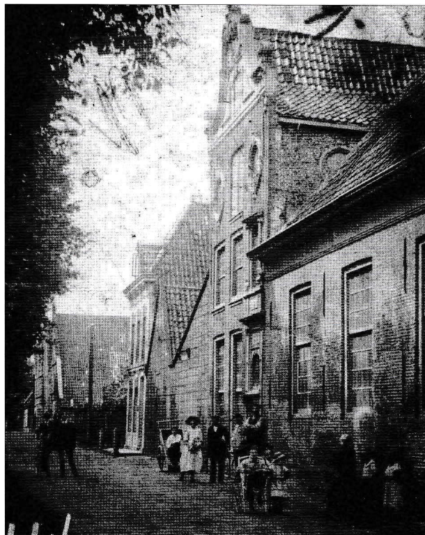
Afb. 2: Vooreiland 20 en 22 omstreeks 1918.