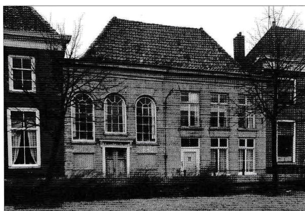
Afb.4: De voormalige Lutherse Kerk met pastorie aan Westerhaven 19-20 (ca. 1950).