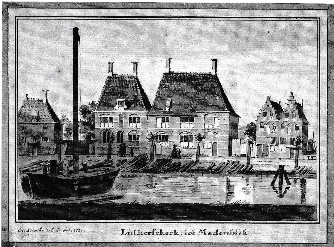
Afb.3: De Lutherse Kerk aan de Pekelharinghaven (1731).

De internationale invloeden in de Lutherse gemeente zorgden ook voor spanningen, met name toen vanaf de tweede en de derde generatie delen van de gemeente vernederlandsten. Maar ook na de Gouden Eeuw, toen Amsterdam zijn vooraanstaande positie aan steden als Londen moest afstaan en de migratiestromen vrijwel stagneerden, bleef met name de invloed vanuit Duitsland groot. Dat kwam vooral doordat nog aan het einde van de 17 e eeuw het merendeel van de predikanten in Nederlandse lutherse gemeenten uit Duitsland afkomstig was.