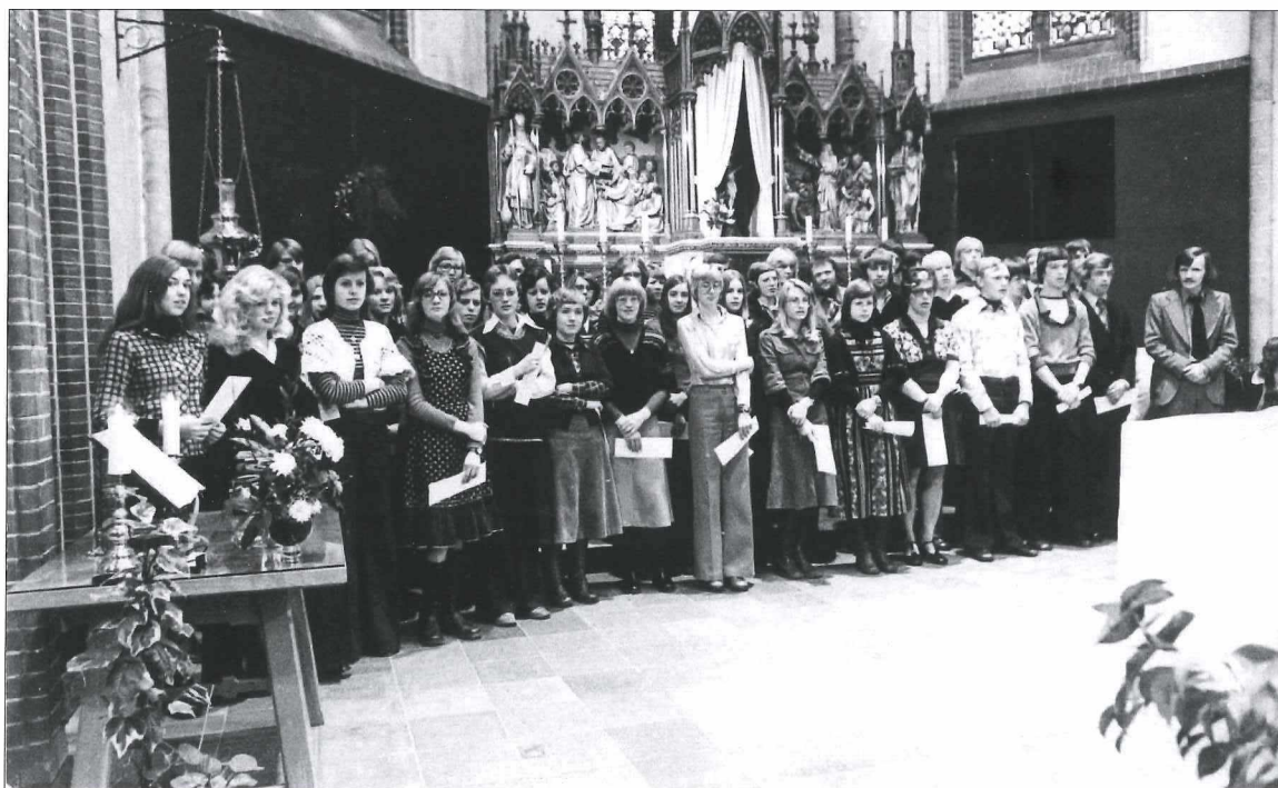
Afb. 1: Jongerenkoor Unciaal (1976).

Jos was destijds nog maar 15 jaar oud, dus moest het bestuur even door de vingers kijken met hun minimale leeftijdsgrens.