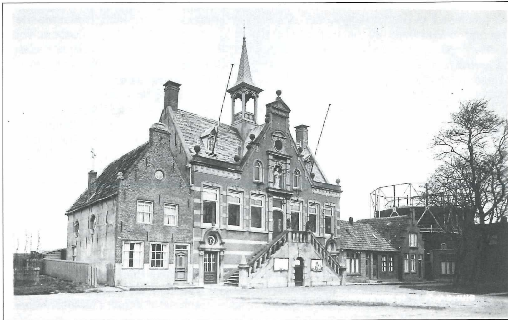
Het Medemblikker stadhuis omstreeks 1930. Dit was het gebouw, waar van oudsher het stadsbestuur en het gerecht van Medemblik bijeenkwamen.