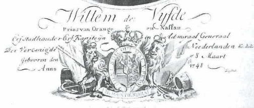
Portret van Willem V. (Collectie auteur).

een stad en een admiraliteit een eigen bestuur en rechtspraak kenden. Pieter Willemsz was maandenlang een speelbal van partijen met tegengestelde belangen. Het was de admiraliteit van Amsterdam versus de stad Medemblick. De admiraliteit verklaarde de schipper bij voorbaat schuldig aan het ongeluk.