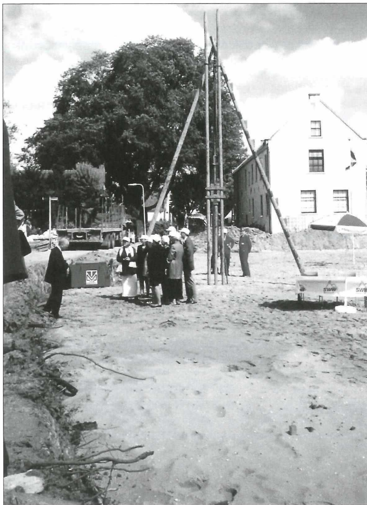
Het slaan van de 1 o paal van woon- en verzorgingshuis "Valbrug".

De Schans, Het Cathrijnehof of Mariaplaats, De Poortklok en nog enkele waaronder " Valbrug ".