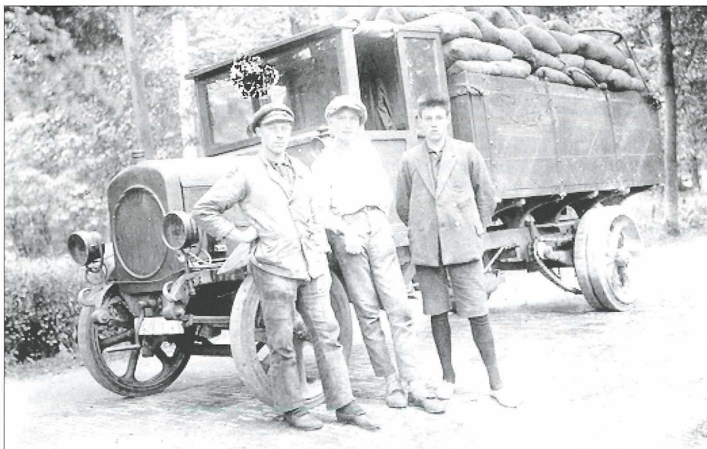
Adler vrachtwagen