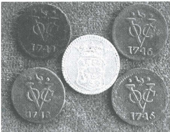
Afb.9: Medemblicker VOC-duiten.

De vierde en de vijfde periode laten geen nieuwe munttypen meer zien. De hernieuwde afspraak de munt om de tien jaar te verplaatsen werd nagekomen. De drie steden Hoorn, Enkhuizen en Medemblick sloegen allen dezelfde munttypen. Veel werd geproduceerd voor de VOC. Medemblicker VOC-duiten zijn nog in redelijke mate verkrijgbaar via Internet of verzamelbeurzen.