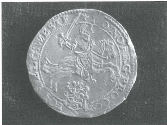
Afb.6: Zilveren rijder 1659 uit het scheepswrak 'de Liefde', dat voor de Schotse kust is vergaan.

Uit deze periode zijn veel scheepswrakken gevonden met forse aantallen zilveren ridders ter waarde van 60 stuivers ofwel drie gulden welke grotendeels in handen van verzamelaars zijn gekomen. Medemblick was de eerste West-Friese stad waar een zilveren rijder werd geslagen (1659).