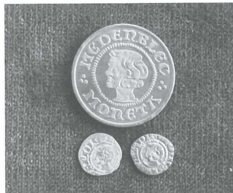
Afb. 2: De penning van Medemblik 700 met twee originele penningen.

In de wereld van de muntverzamelaars is 'kopje' de gangbare naam van dit 13 e eeuwse munttype. Van de moderne penning 'Medemblik 700' zijn er 5002 stuks in cupronikkel, 150 stuks in zilver en het kleine aantal van 20 in 14 karaat goud geproduceerd.