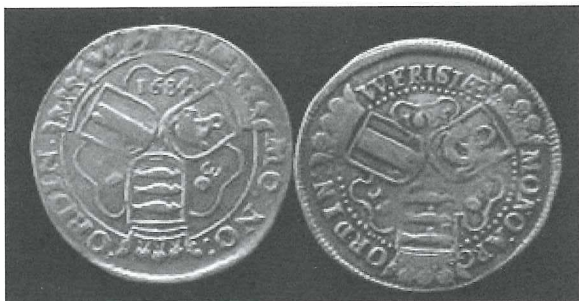
Afb.7: Daalders van 1684 en 1685.

Er zijn ruim 800.000 daalders in Medemblick geslagen, voornamelijk ten behoeve van het binnenlands betaalverkeer. Door het intensieve gebruik, is het voor een verzamelaar moeilijk om een niet-versleten en in goede staat verkerende daalder uit Medemblick te vinden.