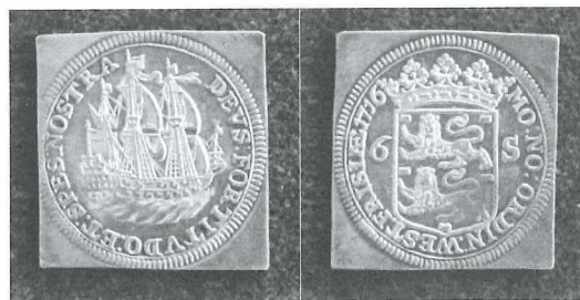
Afb.8: Scheepjesschelling op een vierkant muntplaatje, geslagen te Medemblick in 1716.