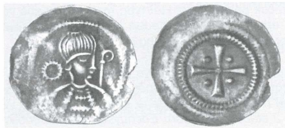
Afb. 1: Munt uit de vondst bij Avendorp.

Ook in de volgende eeuwen ontbreekt het bewijs van gemunt geld uit Medemblik al kan worden aangenomen dat een aantal anonieme muntjes uit de 12 e eeuw uit de munt van Medemblik afkomstig kan zijn.