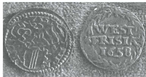
Afb.5: De twee typen duiten van 1658.

'In hetzelfde jaar [1658] is de munt geconsenteert te mogen slaen bij de drie steden van Westvrieslandt 12000 marck cooper aen duyten, op dese voet hebbende op de eene zyde de 3 wapens van de 3 steden als Hoorn Enchuysen en Medemblicq, in het ronde met dese letteren: "Westfrisia 1658" en aen de andere kant het wapen van Westvrieslandt met dese letteren daerom: Deus Fortitudo Et Spes Nos. Dewijl dit fatsoen van duyten veracht wierden, sijnde weder op de ouden voet geslagen.'