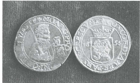
Afb.4: Het type rijksdaelder bestemd voor Oostzeehandel. Dit exemplaar is gevonden in Litouwen.