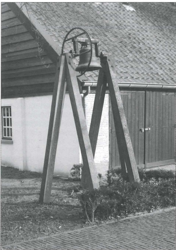
Afb. 1: De klok op het terrein van 'Duin en Bosch'.

Dat was een alarmerend bericht. In ieder geval ondernamen we gelijk maar actie. Ik zou die week toch richting Bakkum/Castricum gaan. De klok moest hangen op het terrein van de psychiatrische inrichting 'Duin en Bosch', de plek waarheen in 1967 patiënten en medewerkers uit Medemblik verhuisden. Op het enorme terrein aankomende, zag ik veel sloop- en bouwactiviteiten. Na veel zoeken en vragen vond ik uiteindelijk de klok op zes palen van circa drie meter hoogte gemonteerd. Het hele gevaarte stond wat achteraf bij een gebouwtje dat blijkbaar als magazijn dienst deed.