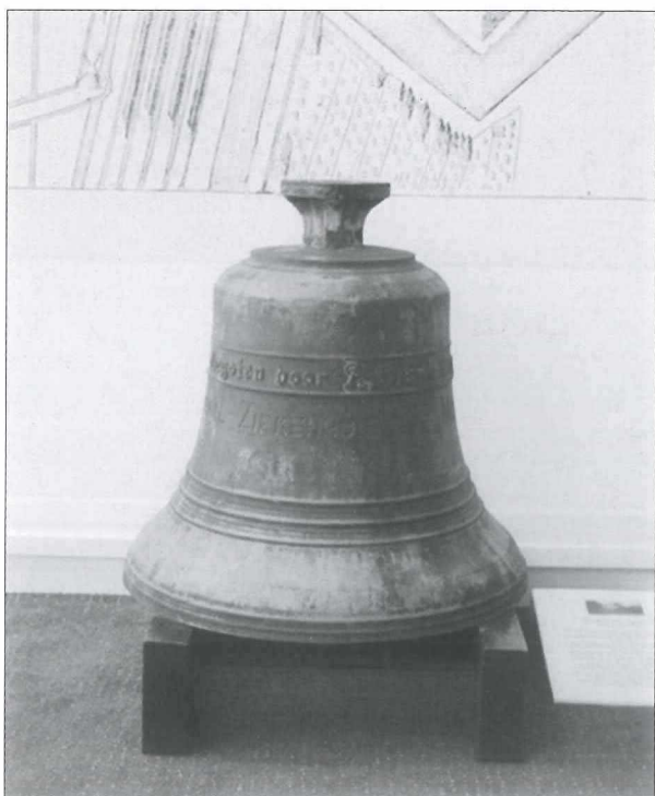
Afb.4: De klok in het Stadsmuseum.