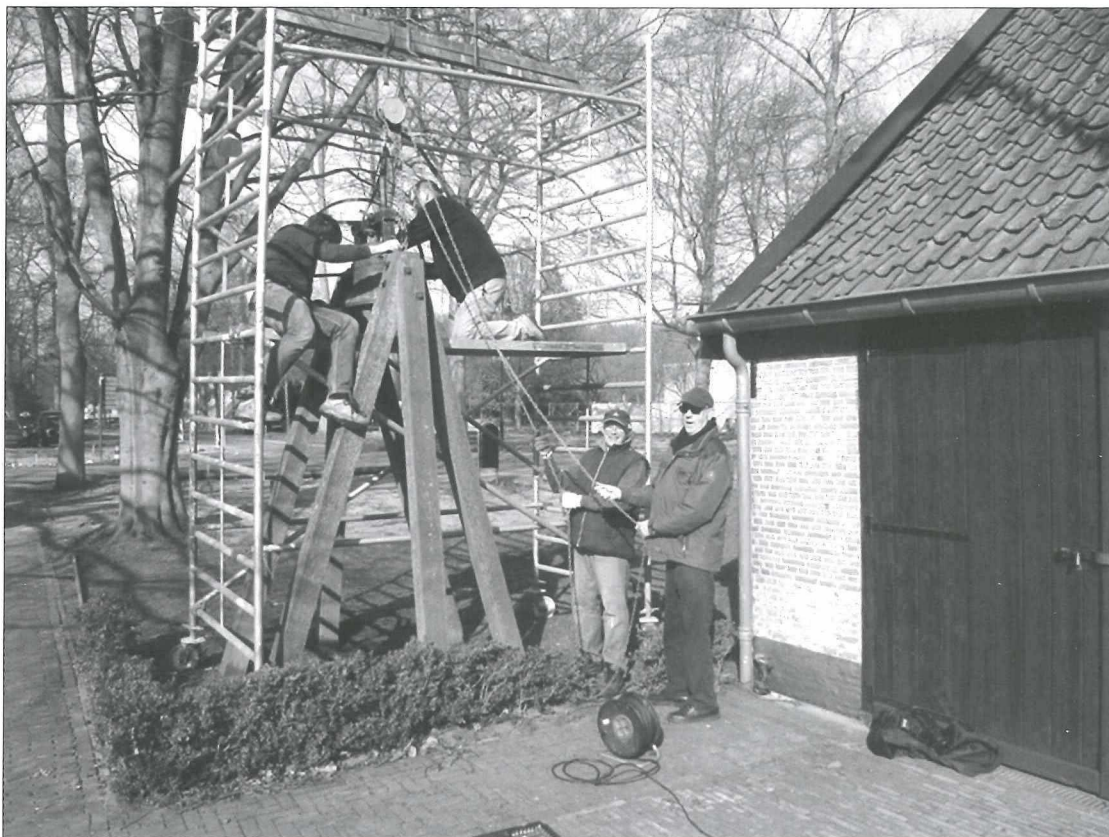
Afb.3: De klok wordt voorzichtig naar beneden getakeld.