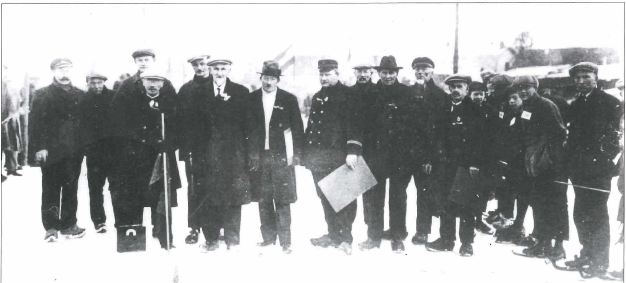
Afb. 2: Bestuursleden en vrijwilligers van de IJclub Medemblik in een winters decor (1930).

Een andere vroege vereniging is de voorloper van Harddraverijvereniging Prins Hendrik 1 .