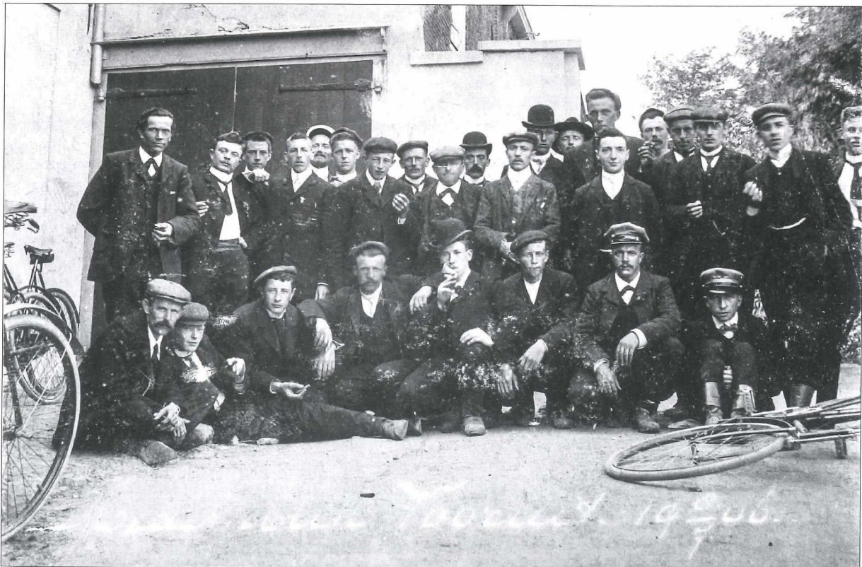
Afb. 3: De 'heren' van de Rijwielclub "Medemblik Vooruit" (1906).