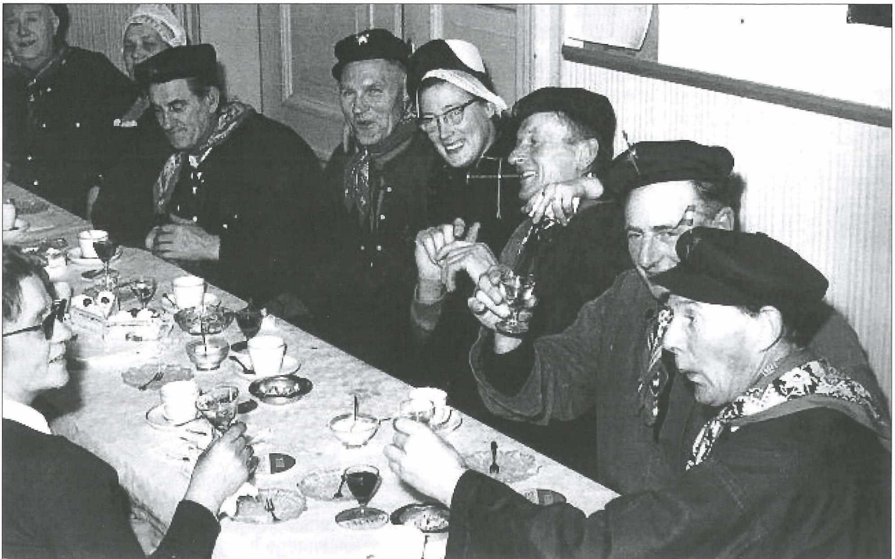
Afb.3: De start van de feestavond eind jaren vijftig: koffie met gebak en daarna aan de borrel.

Hoogtepunt van de feestdag werd natuurlijk gevormd door het diner. Kennelijk was van meet af aan duidelijk dat een varken hiervoor de hoofdbestanddelen zou leveren. Ook voor Medemblick was het zelf vetmesten of aankopen, laten slachten en vervolgens opeten van een varken in verenigingsverband een geheel nieuw fenomeen.