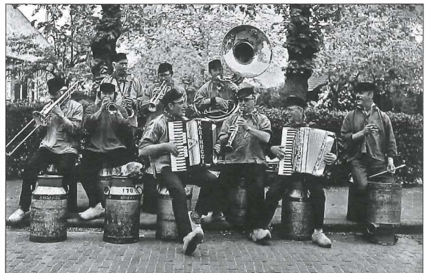
Afb. 2: De leden van het populaire orkest 'De Boertjes van Buuten' (voorheen De Bietenbouwers) waren sedert 1948 ook uitgedost als Gelderse boeren (ca. 1970).

In de vergadering van april 1954 (datum ontbreekt!) dringt de voorzitter, blijkens het verslag, er bij de leden op aan om bij gelegenheden gekleed te gaan als 'Gelders boertje'. Er is kennelijk verdeeldheid onder de leden rondom dit voorstel, want het punt wordt aangehouden tot de volgende vergadering. In de daarop volgende vergadering (juni 1954) komt het punt van het kostuum weer op de agenda. De voorzitter doet hierbij het voorstel dat ieder lid op de volgende vergaderingen en op de feestdag gekleed gaat in een blauwe kiel met boerenpet en klompen draagt als schoeisel. Blijkens het verslag waren niet alle leden geporteerd van deze boerenuitdossing. De voorzitter kon deze terughoudendheid uiteindelijk echter wegnemen door te wijzen op de voordelen van eenheid en herkenbaarheid van de vereniging tijdens allerlei festiviteiten en gelegenheden.