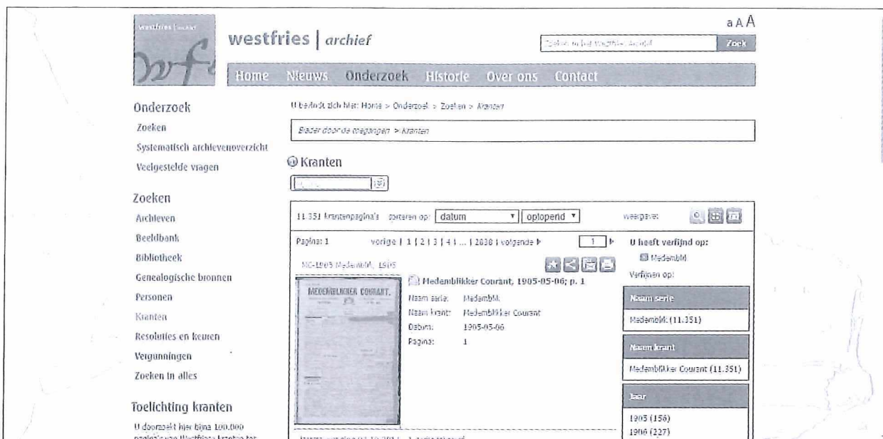
Afb.5: Website van het Westfries Archief. Linksboven het midden is de balk waar u zoekwoorden kunt invoeren.

Vóór het midden van de negentiende eeuw domineerden in Medemblick en West-Friesland de kranten uit Haarlem en Amsterdam. Vooral de Oprechte Haarlemsche Courant, uitgegeven sinds 1656(!), is zeer de moeite waard en bevat tal van berichten en advertenties uit Medemblick. Via de website www.delpher.nl is deze krant doorzoekbaar.