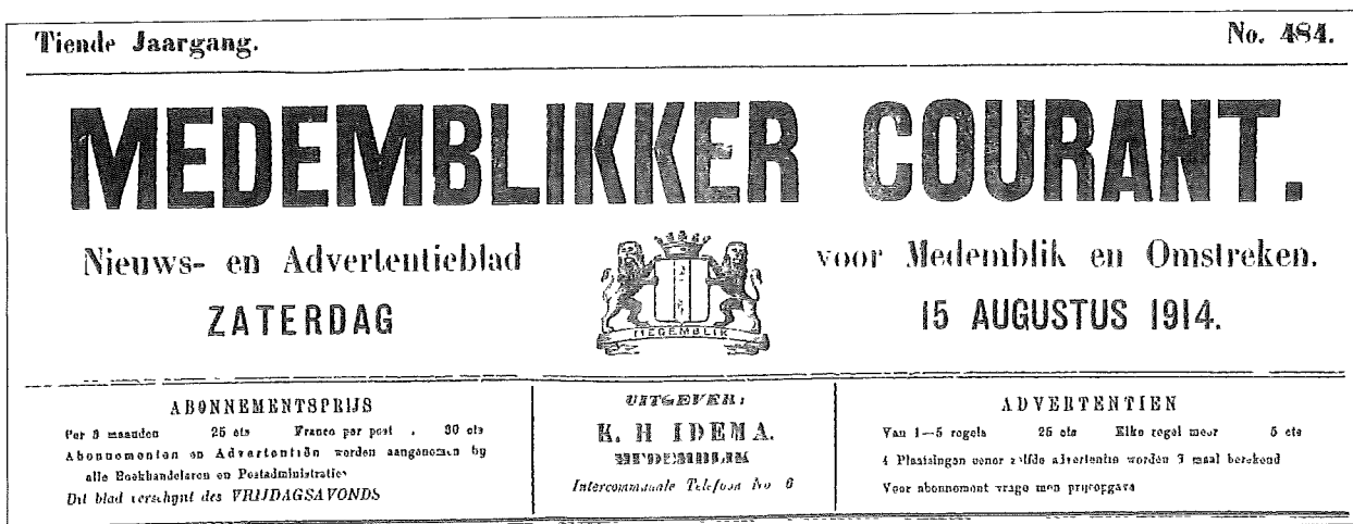
Afb 2 Medemblikker Courant anno 1914

Maar precies een week na de bevrijding verscheen de krant al weer.