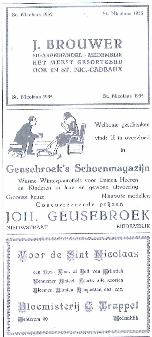
Afb.4: Selectie advertenties uit de Medemblikker Courant van 9 november 1935.