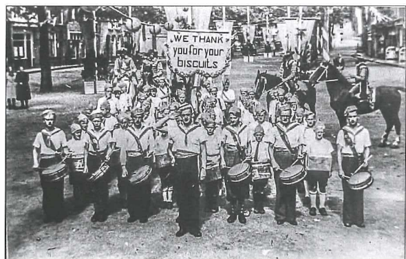
Afb.3: Bevrijdingsfeesten (mei 1945).